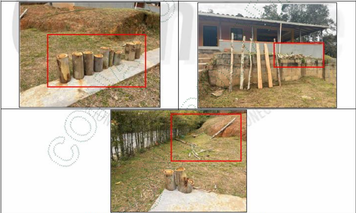
Imagen 1 – Tala de Eucalipto / Transformación de madera.