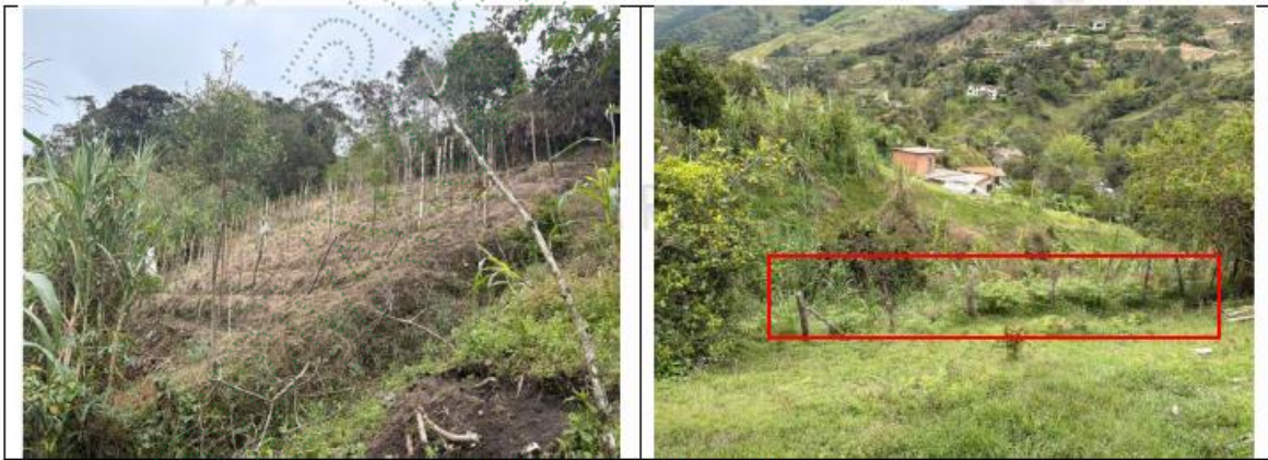
Imagen 3 – Uso de la madera.

Debido a que el señor Oscar García ha hecho aprovechamiento forestal progresivo en diferentes puntos y en diferentes tiempos según la necesidad, se evidencia el uso para tipo cercado o para huertas dentro del predio.