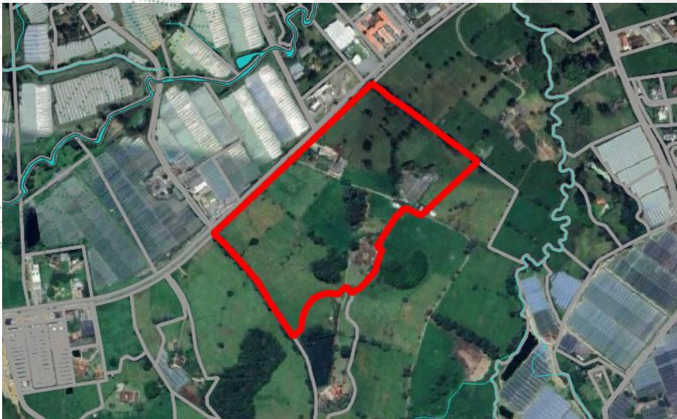
Imagen 1. Ubicación predio de interés

3.2 En cuanto al predio donde se ubican los árboles de interés: Se encuentra ubicado en la vereda Guamito del municipio de La Ceja, presenta un paisaje de montaña con un relieve de filas y vigas, además, hace parte de un corredor suburbano conforme el POT del municipio. El objetivo del aprovechamiento es terminar de adecuar el espacio para la construcción de una estación de servicios y mall comercial.