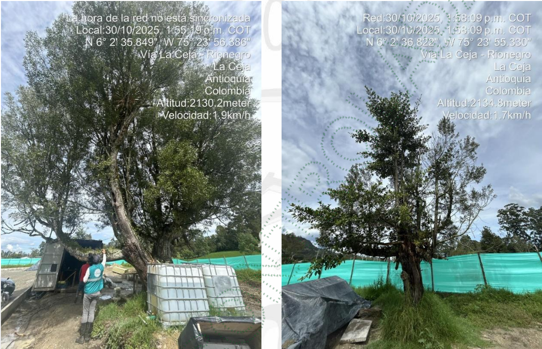
Imagen 3 y 4. Árboles a intervenir

4.1 Viabilidad: Técnicamente se considera VIABLE el APROVECHAMIENTO FORESTAL DE ÁRBOLES AISLADOS POR FUERA DE LA COBERTURA DE BOSQUE NATURAL , en el predio con FMI 017-74264, ubicado en la vereda Guamito del municipio de La Ceja, para las siguientes especies: