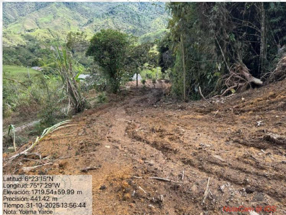
Imagen 3. Apertura de vía.