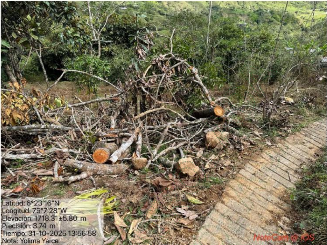
Imagen 4. Residuos de árboles talados.