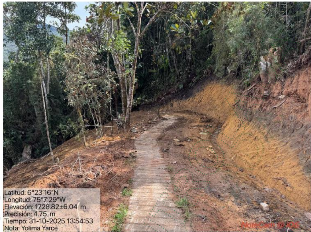
Imagen 2. Apertura de vía.

Durante el recorrido no se observaron fuentes hídricas intervenidas por las actividades de movimientos de tierras ni otras intervenciones sobre los recursos naturales que pudieran conformar una infracción ambiental