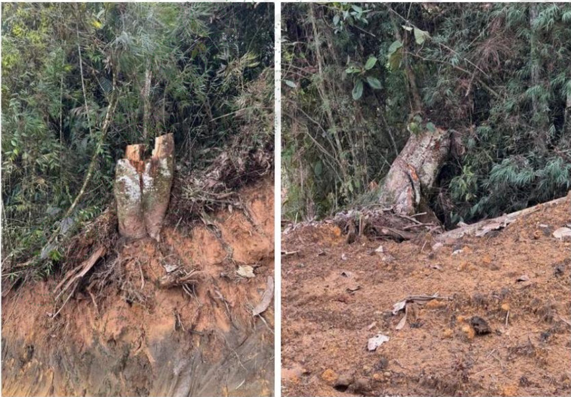
Imágenes 5 y 6. Tocones de árboles talados.