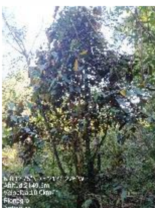
Imagen 5 - 14. Compensación realizada con la siembra de los árboles nativos en el predio.