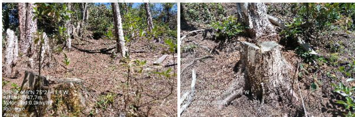
Imagen 3 y 4. Sitio de aprovechamiento de los árboles aislados y disposición de los residuos vegetales

El usuario realizó la siembra de los 270 árboles con especies nativas con las especies como Uvitos, Acacia, Camargo, Palma Sarro, Quiebrabarrigo, Caucho, Siete Cueros, Espaderos, Yarumo y Drago, entre otras especies. Los árboles establecidos presentan buen crecimiento y desarrollo. Estas especies fueron sembradas en diferentes puntos del predio, y en áreas aledañas a un nacimiento de agua que colinda con el predio y zona de bosque natural.