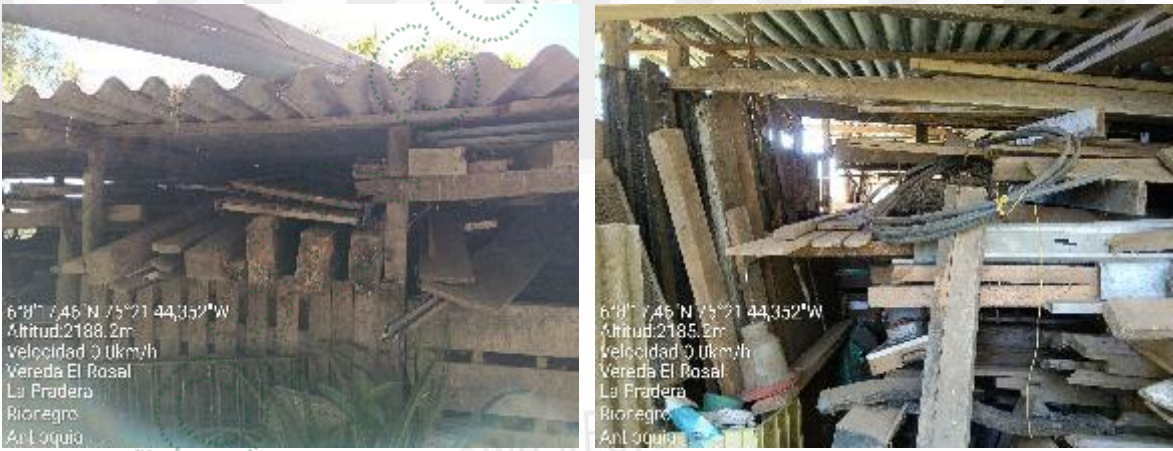
Imagen 19 - 20. Madera transformada, que se encuentra en el predio.

En el predio se encuentra una madera la cual se encuentra almacenada para ser usada dentro del predio.