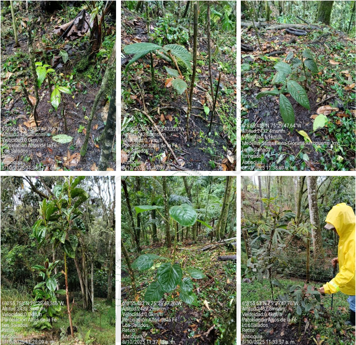
Imagen 9 - 21. Compensación realizada con la siembra de los árboles nativos en el predio.