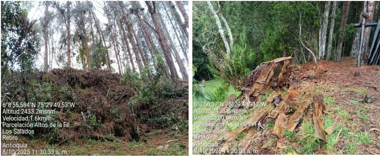
Imagen 22 y 23. Sitio, manejo y disposición final de los restos de residuos vegetales.