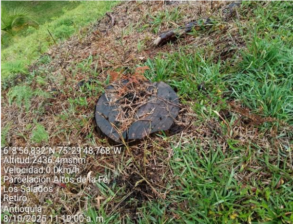
Foco de aprovechamiento.

El usuario realizó la siembra de los 96 árboles con las siguientes especies nativas como Amarrabollos (34), Guamos (15), Balsos (39), Guayacanes (5), Chagualos (3), Yarumos (45), entre otras especies. Los arboles establecidos presentan buen crecimiento y desarrollo. Estas especies fueron sembradas en áreas aledañas a un nacimiento de agua que discurre con el predio y un área con bosque natural.