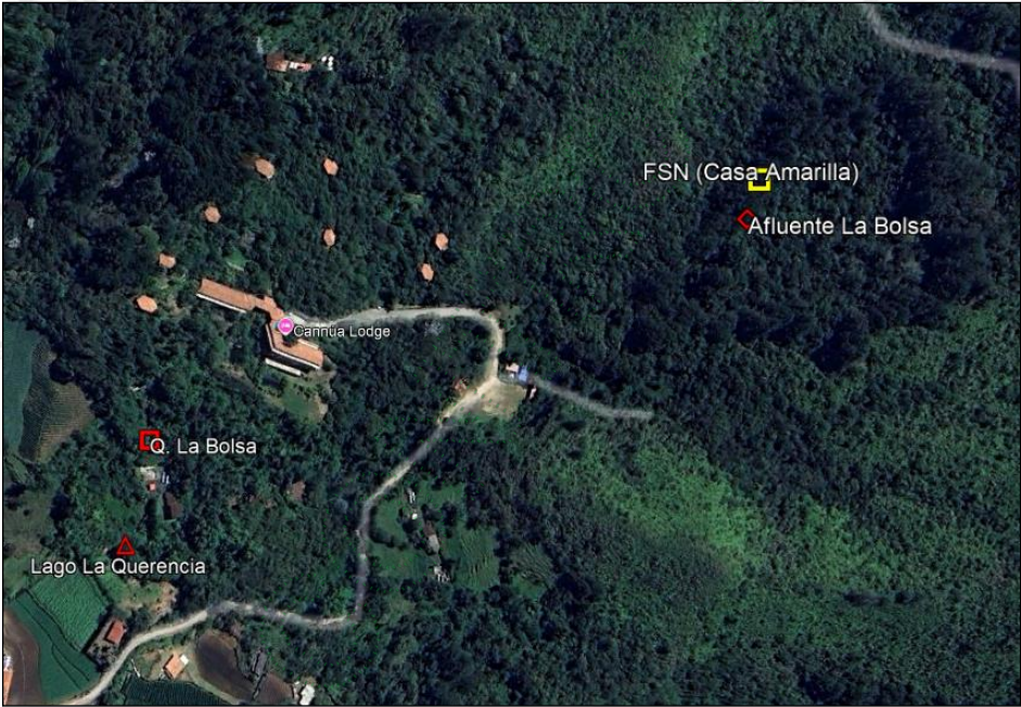
Figura 1. Localización de la CANNÚA ECOLODGE y las captaciones Casa Amarilla, Q. La Bolsa y Lago La Querencia

3.2 Para acceder al sitio donde se desarrolla el proyecto CANNÚA ECOLODGE, saliendo del casco urbano del municipio Marinilla, se transita por la vía que conduce hacia el municipio El Peñol, a 1450 m se toma a mano derecha por una vía veredal por espacio de 6,0 km, hasta llegar al Edificio donde se encuentra el Hotel CANNÚA ECOLODGE. En la figura 1, se presenta la ubicación dl Hotel y de las captaciones de la fuente Q. La Bolsa, Lago La Querencia y FSN (Casa Amarilla).