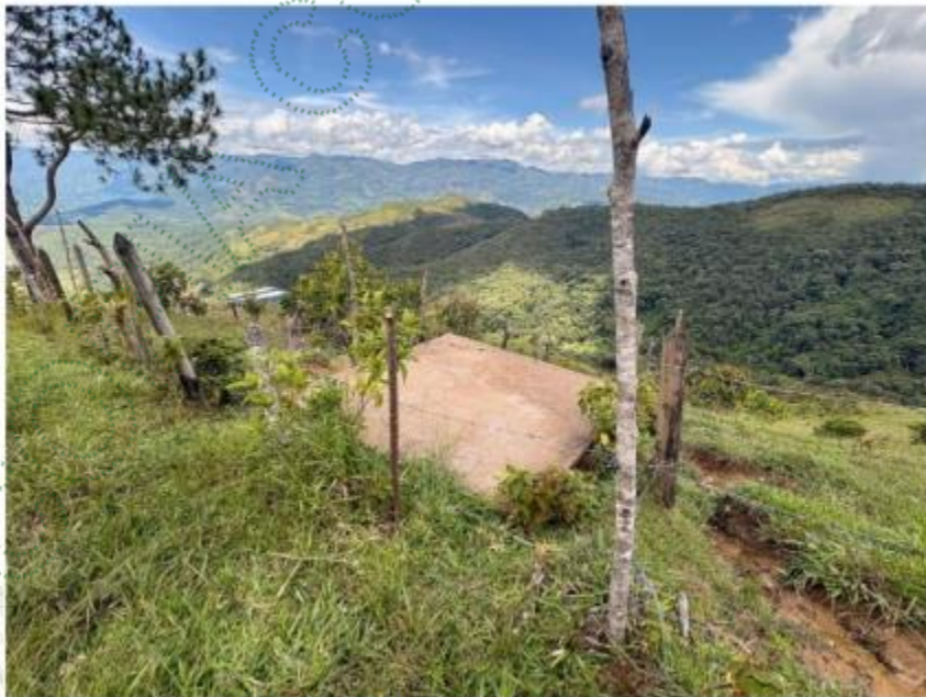
Imagen 4 Pozo Séptico Mampostería.