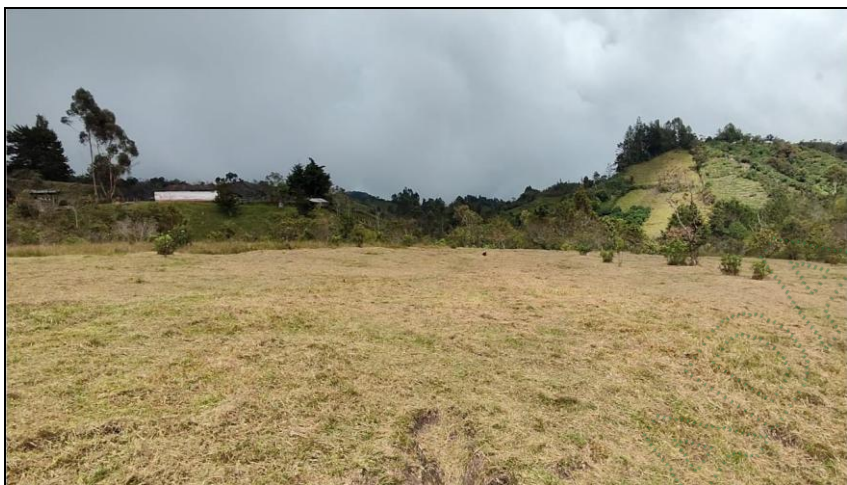
Imagen 3 – Condiciones del suelo en temporada seca.

De acuerdo con la evidencia fotográfica y los criterios diagnósticos iniciales, el área no presenta rasgos de humedal ni condiciones de inundación o encharcamiento permanente. El terreno corresponde a una pradera seca o pastizal de uso agropecuario, con drenaje funcional y sin indicios de afectación por cuerpos de agua o ecosistemas húmedos.