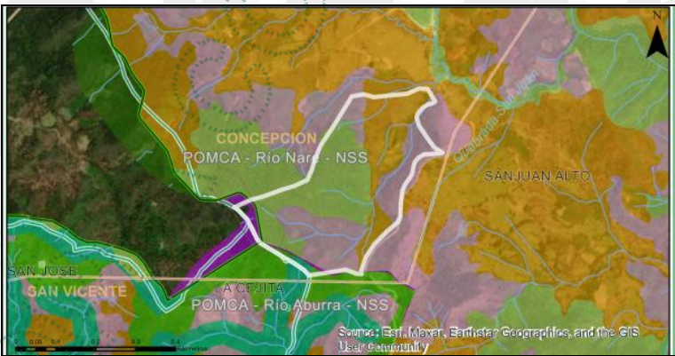
Imagen 3. Zonificación ambiental – Geo portal