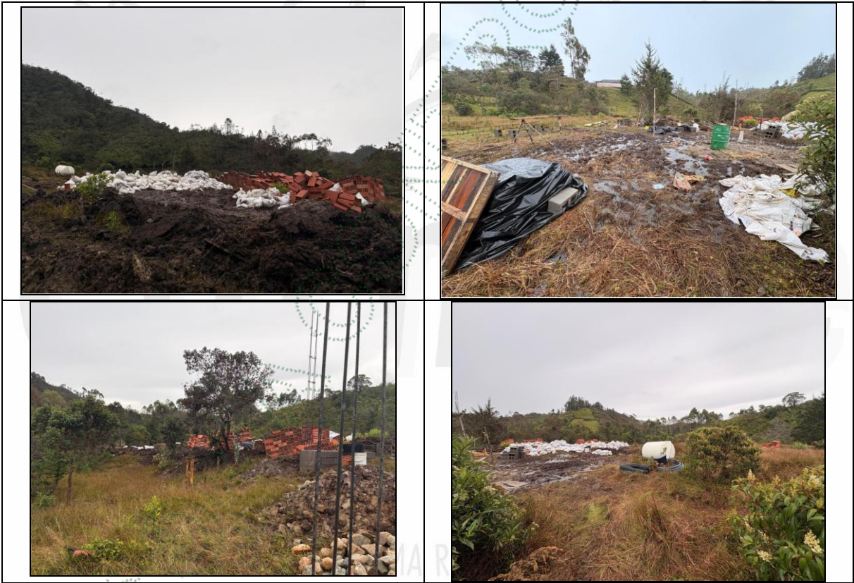
Imagen 1. Construcción de vivienda nueva – Obra en Ejecución.

Durante la inspección ambiental se evidenció: