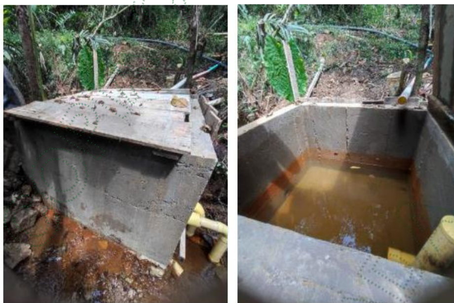
Foto 1. Tanque en concreto sobre Quebrada Sin Nombre.

Esta fuente cuenta con un cauce 2 m de ancho y una profundidad de 50 cm aproximadamente.