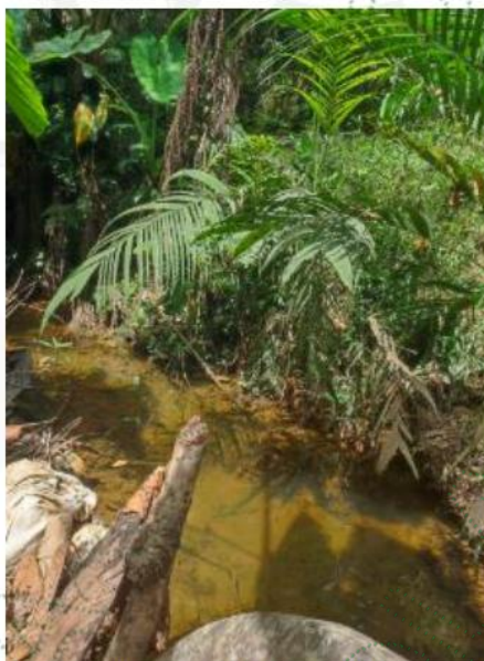
Foto 2. Quebrada sin movimiento en la parte trasera del tanque.

Con la construcción de la obra en concreto se está obstaculizando el curso natural del agua y en la parte trasera del mismo ésta se halla sin movimiento, como se observa en la siguiente foto: