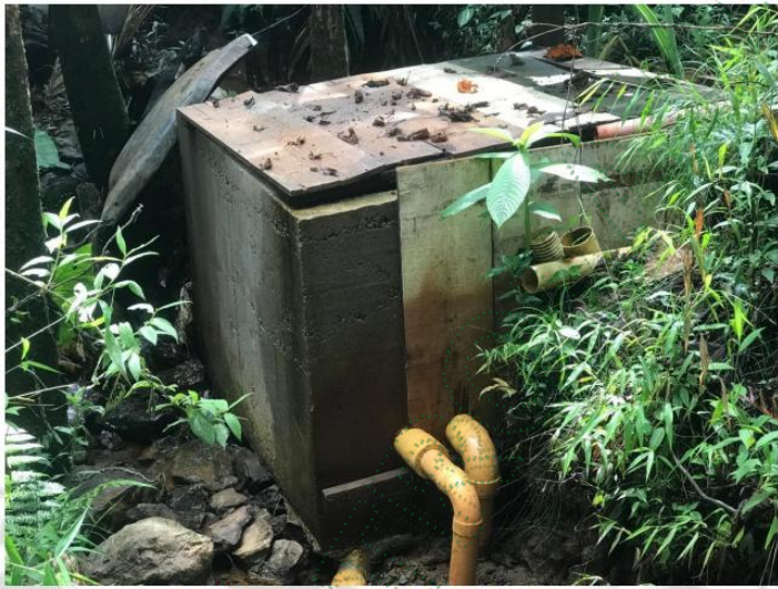
Figura 1. Tanque sobre cauce de la quebrada sin Nombre

El día de la visita se evidenció que el tanque con dimensiones de 1 m de alto, 1.5 m de ancho y 1.5 m de largo aproximadamente, aún se encuentra operando y ubicado sobre el cauce de la quebrada sin Nombre y no ha sido demolido, conforme ordena Cornare en la Resolución RE-01069-2024, información que reposa en el expediente 056900343433.