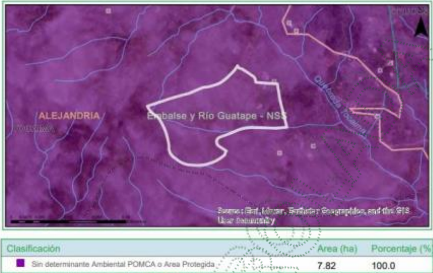
Figura 2. Determinantes Ambientales