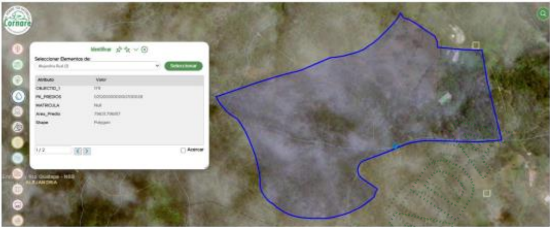
Figura 4. Ubicación del predio