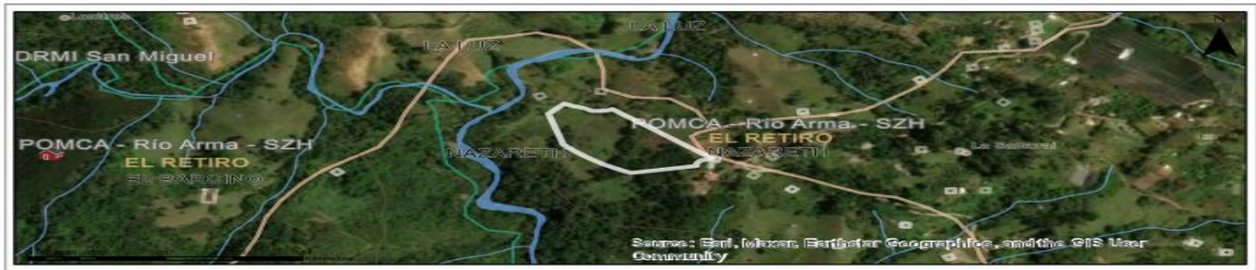
Imagen 1. Ubicación del predio de interés

De acuerdo con la información que reposa en la solicitud y lo verificado en la visita de campo, los árboles objeto de aprovechamiento corresponden a cincuenta y un (51) individuos, de diferentes especies nativas. (Tabla 1.)