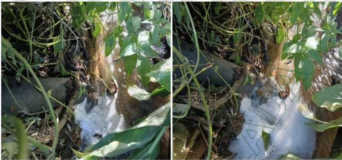
Imagen 6 y 7: Descargas directas de aguas residuales domésticas sin tratamiento a la Quebrada Papayal.