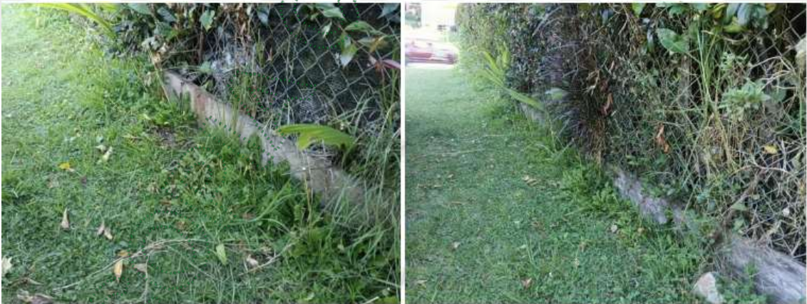
Imagen 4 y 5: Estado actual del predio donde presuntamente se han venido generando descargas de aguas residuales

3.9 Sin embargo, durante la inspección ocular, no fue posible corroborar esta afirmación. Como se observa en las imágenes 4 y 5, el área, en el prado no se observan signos de afectación, por alta humedad, malos olores, vectores o vegetación asociada a altas cargas de materia orgánica.