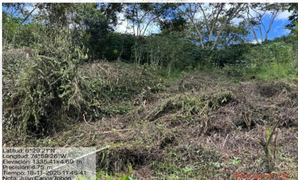
Imagen 2. Vista panorámica del área intervenida.

En el sitio se observaron algunos residuos de madera compuestos por ramas con diámetros menores a los 10 cm, provenientes de podas o desramas realizados en los árboles aislados que no fueron talados. No se observaron tocones u otros indicios que demuestren que se hayan realizado talas de árboles.