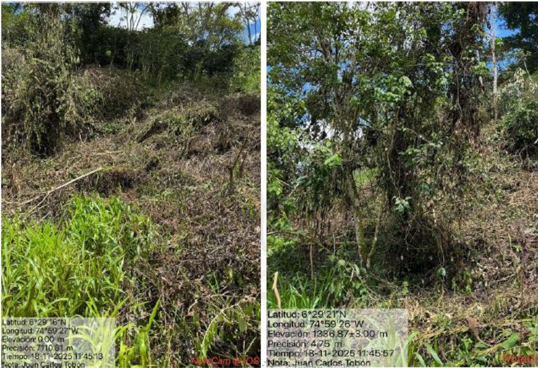
Imágenes 3 y 4. Área intervenida y vista de coberturas.

Durante la inspección se evidenció una fuente hídrica Sin nombre, ubicada a aproximadamente 62 metros lineales del punto de intervención, por lo que no se vio afectada su ronda hídrica.