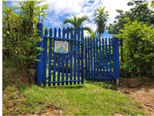
Figura 2. Planta de Potabilización - Asociación de Usuarios del Acueducto y Alcantarillado Las Mercedes.