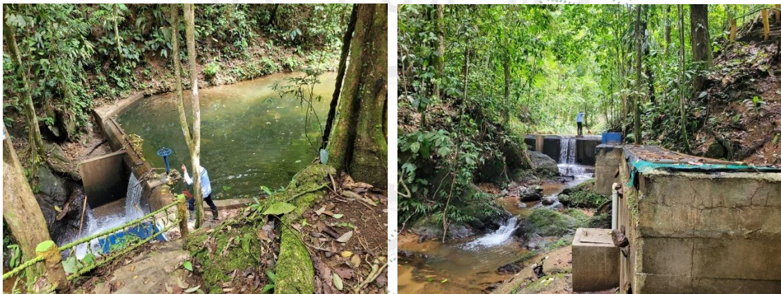
Figura 5. Punto de captación sobre la Quebrada denominada “la Corozal”

La obra de captación cuenta con una longitud de 17 metros, un ancho de 9.23 metros y una profundidad aproximada de 1.69 metros, cuenta con una rejilla de varilla metálica de 1/2" con unas dimensiones de 0.23 cm de ancho, por 76 cm de largo, de donde parte la aducción de aproximadamente 2.30 metros en tubería de 6 pulgadas recubierta en cemento, que va conectada a un compartimiento de aquietamiento. Desde allí continua la tubería de 6 pulgadas sostenida en columnas en concreto hasta el desarenador.