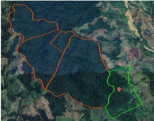
Figura 1. Predio donde se ubica el punto de captación (color verde) y Predios reserva La Corozal (color naranja) – Fuente hídrica La Corozal