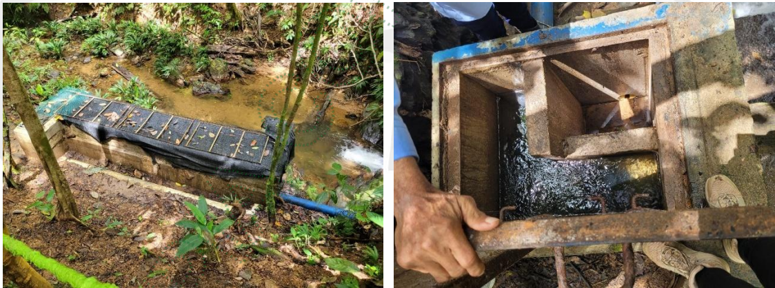
Figura 6. Desarenador y tanque de aquietamiento

De acuerdo a la información suministrada en el censo de usuarios, se tiene la siguiente población: