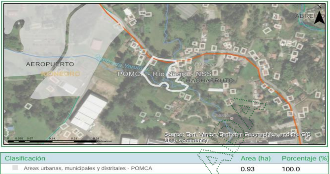
Imagen 2. Zonificación ambiental del predio según el POMCA del Río Negro.

Áreas urbanas, municipales y distritales - POMCA: El desarrollo se dará con base en la capacidad de usos del suelo y se aplicará el régimen de usos del respectivo Plan de Ordenamiento Territorial (POT); así como los lineamientos establecidos en los Acuerdos y Determinantes Ambientales de Cornare que apliquen.