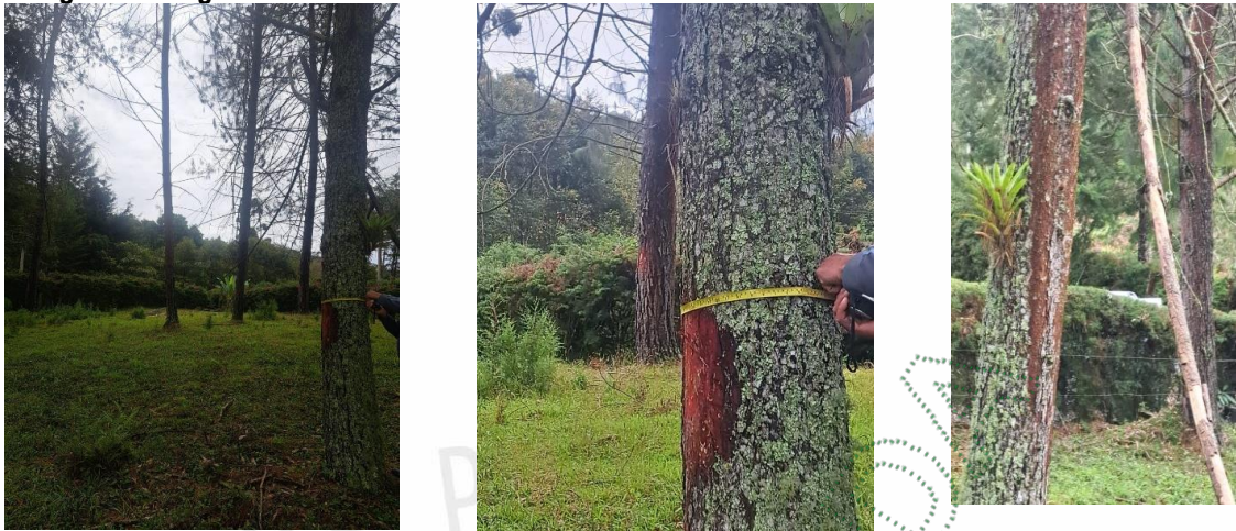
Individuos arbóreos verificados, se observó epífita.

4.1. Viabilidad: Técnicamente se considera VIABLE el APROVECHAMIENTO FORESTAL DEL ÁRBOL AISLADO , en beneficio del inmueble identificado con FMI-020-79372, ubicado en la vereda Chachafruto del municipio de Rionegro, Antioquia, para las siguientes especies, de acuerdo con la categoría del POMCA Rio Negro: