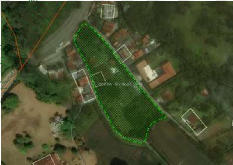
Imagen 1. Ubicación predio de interés