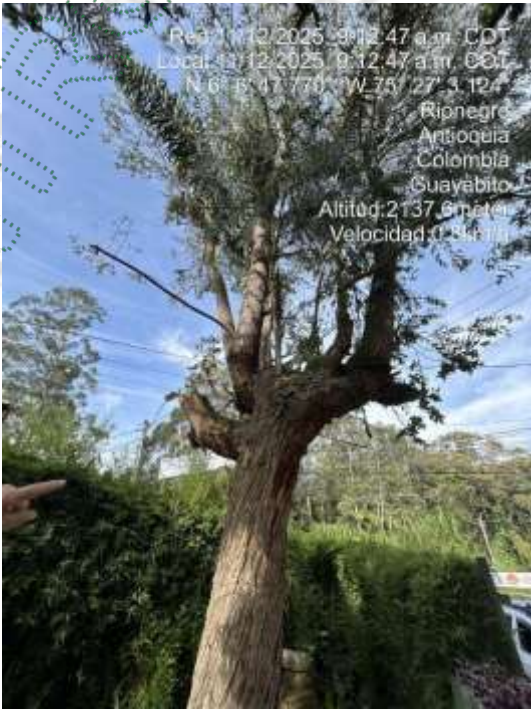
Imagen 3 y 4. Arbol a intervenir

4.1 Viabilidad: Técnicamente se considera VIABLE el APROVECHAMIENTO FORESTAL DE ÁRBOLES AISLADOS POR FUERA DE LA COBERTURA DE BOSQUE NATURAL , en el predio con FMI 020-7180, ubicado en la vereda Guayabito del municipio de Rionegro, para la siguiente especie: