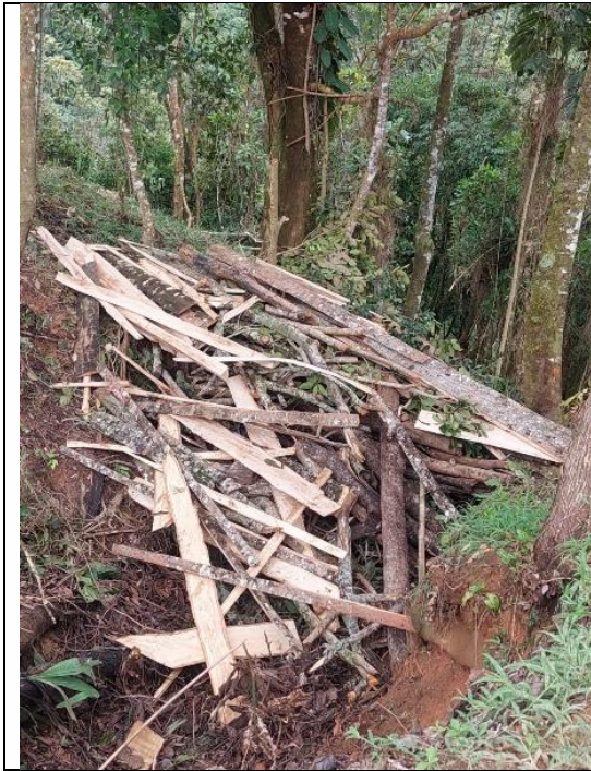
Imagen 20. Residuos del aprovechamiento forestal