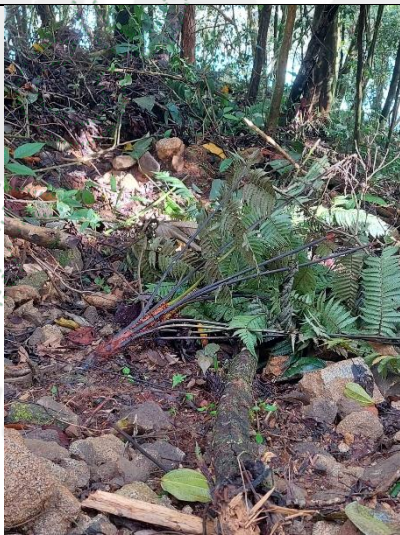
Imagen 10. Corte de Helecho arbóreo.(veda)