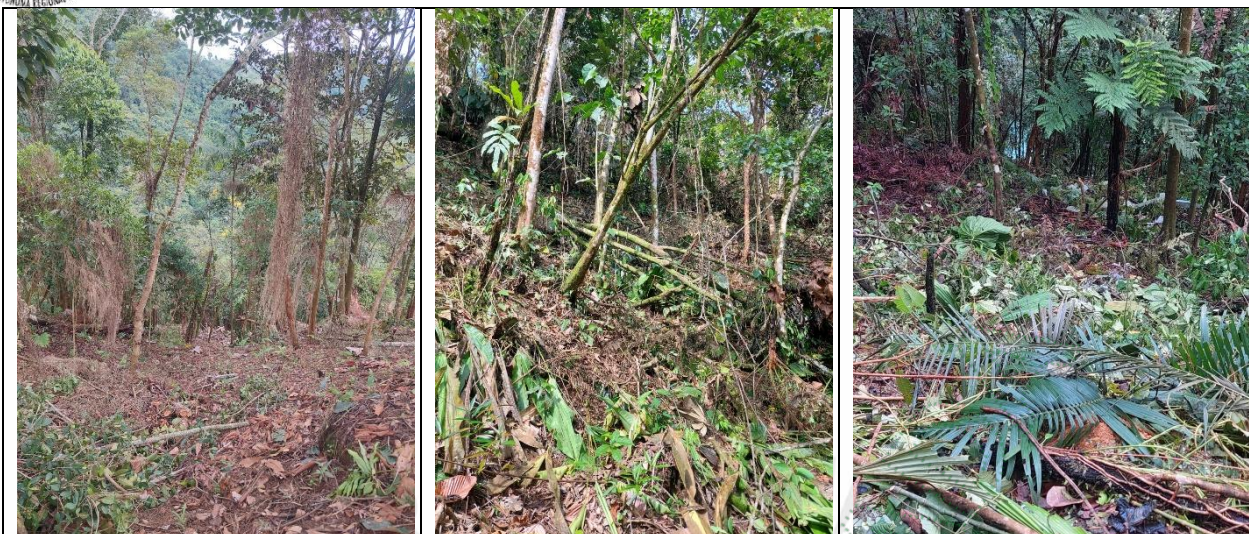
Imagen 12, 13 y 14. Socla del bosque natural.