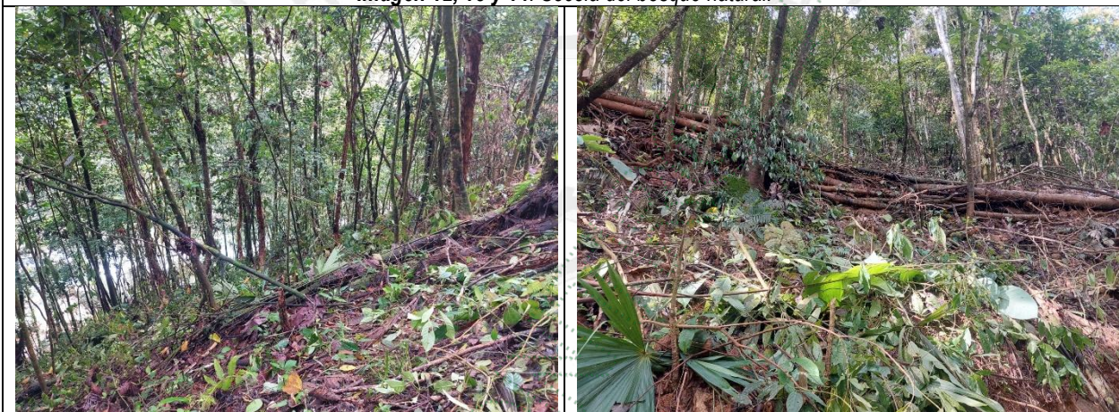
Imagen 15, 16, 17. Socla de bosque natural y residuos de aprovechamiento.

3.7. Se observó el acopio de madera de los árboles aprovechados correspondiente a la especie perillo ( Schizolobium parahyba ), donde se midió un volumen aproximado de 2,8 m 3 de madera.