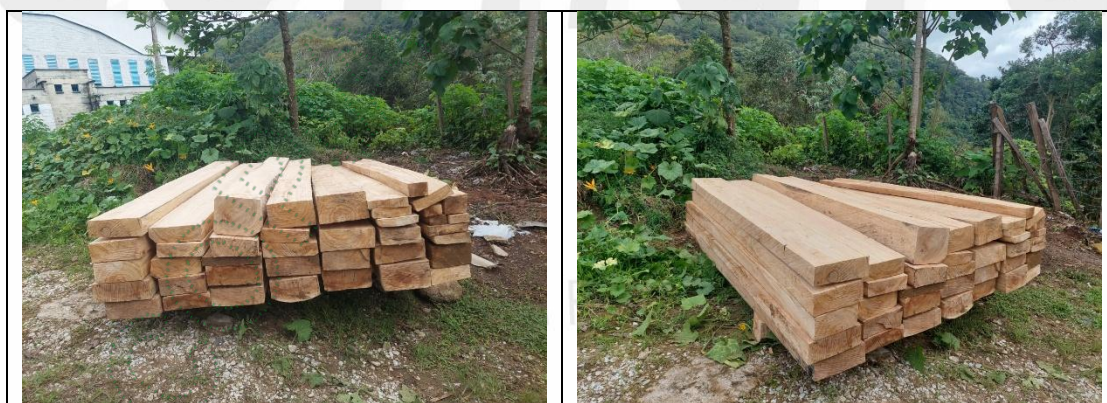
Imagen 18 y 19. Acopio de madera encontrado en el predio

3.7. Se observó el acopio de madera de los árboles aprovechados correspondiente a la especie perillo ( Schizolobium parahyba ), donde se midió un volumen aproximado de 2,8 m 3 de madera.