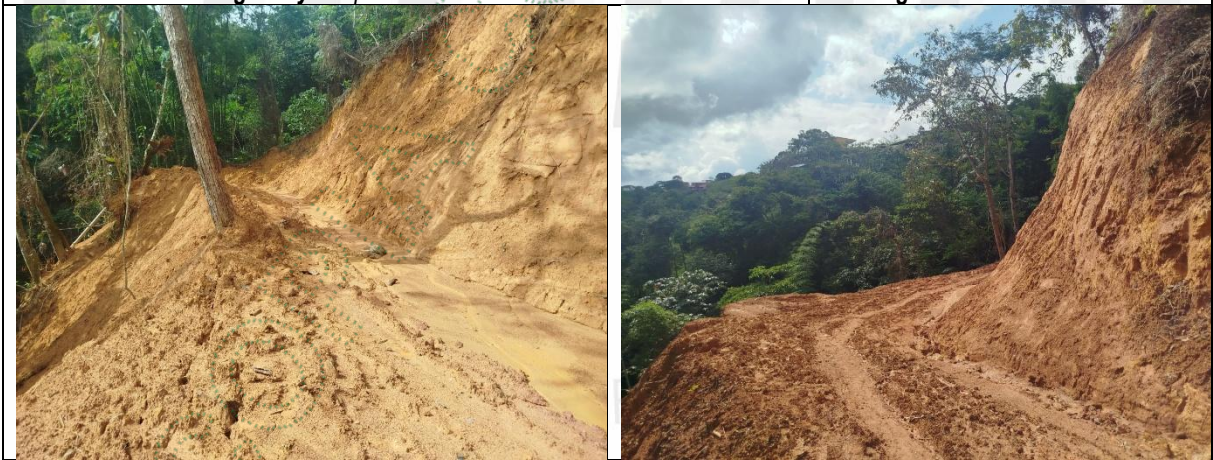
Imagen 5 y 6. Movimiento de tierra realizado con maquinaria.