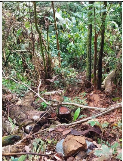
Imagen 11. Residuos de aprovechamiento.