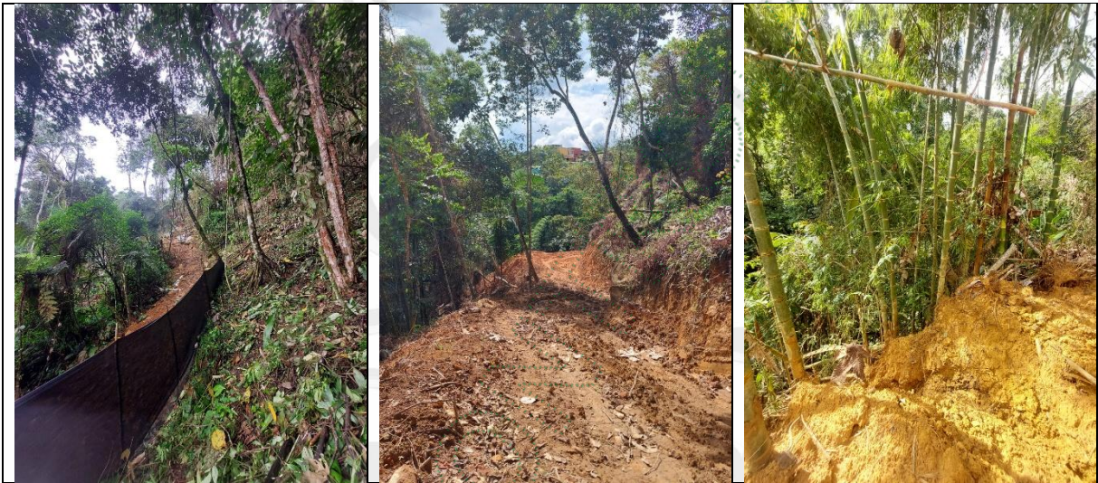
Imagen 2 y 3. Apertura de camino manual.