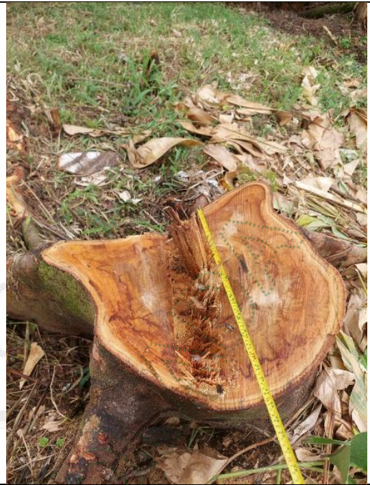
Imagen 21. Tocon de árbol aprovechado.

3.8. Se procede a verificar en el sistema de información geográfica Map-Gis de Cornare, los Determinantes ambientales del predio identificado con PK_PREDIO 056600001000000180135000000000. Según zonificación ambiental, el predio se encuentra dentro de la zonificación ambiental POMCA del Río Samaná Norte, aprobado mediante la Resolución 112-7293-2017 y Resolución 112-0395-2019 por medio de la cual se establece el régimen de uso. La zona donde se realizaron las actividades se encuentra mayormente dentro de Áreas de Amenaza Naturales, que ocupa 54,94% del área del predio con 1,9 ha, determinadas en la zonificación ambiental como Áreas de Protección. Las demás áreas donde se desarrollaron las actividades corresponden a Áreas de Restauración Ecológica correspondiente al 42,34% del predio con un área de 1,46 ha, en la cual se deberá garantizar una cobertura boscosa de por lo menos el 70% en cada uno de los predios que la integren, en el otro 30% podrán desarrollarse las actividades permitidas en el respectivo Plan de Ordenamiento Territorial – POT del municipio.