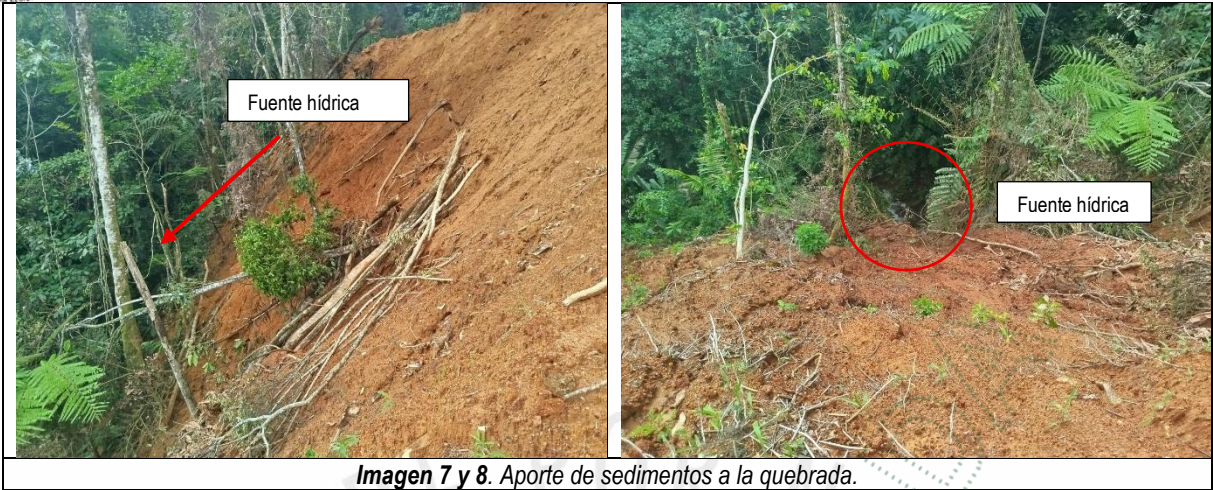
Imagen 7 y 8. Aporte de sedimentos a la quebrada.