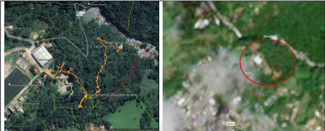
Imagen 1. Localización del sitio donde se está realizando el movimiento de tierras.