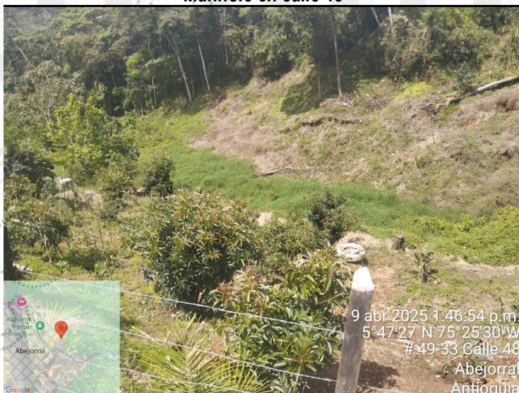
Colector entre calle 48 y carrera 49