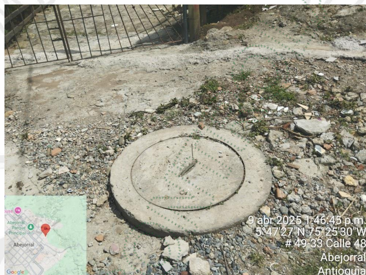
Manhole en calle 48

Con el fin de determinar el estado actual de la situación que originó la queja, se realiza visita de campo el día 09 de abril del año en curso al sitio de interés, encontrando que se construyeron los colectores en la calle 48 entre carreras 50 y calle 50.