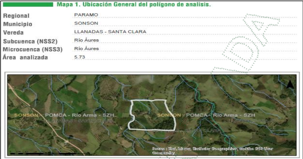
Ubicación predio F.M.I N° 028- 13970, fuente Geoportal Mapgis CORNARE 2025

3.2 Para acceder al predio de interés desde el municipio de Sonsón, se toma la vía que conduce a la vereda Llanadas Santa Clara, aproximadamente a 13 km hasta un punto que se encuentra dos vías donde se ubica la parroquia de la vereda, se dirige a mano derecha aproximadamente unos 630 metros y al margen derecho se encuentra una portada de rejas negra donde se ubica el predio de interés. El predio cuenta con un área alrededor de 5.74 Ha, la topografía del predio es pendiente media, destinado una parte al cultivo de aguacate y otra pequeña parte a la ganadería, en relación a los recursos naturales se encuentra una cobertura vegetal media – baja, con especies nativas.