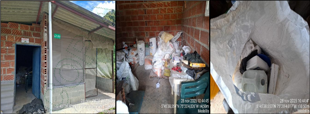
Bodega de agroquímicos