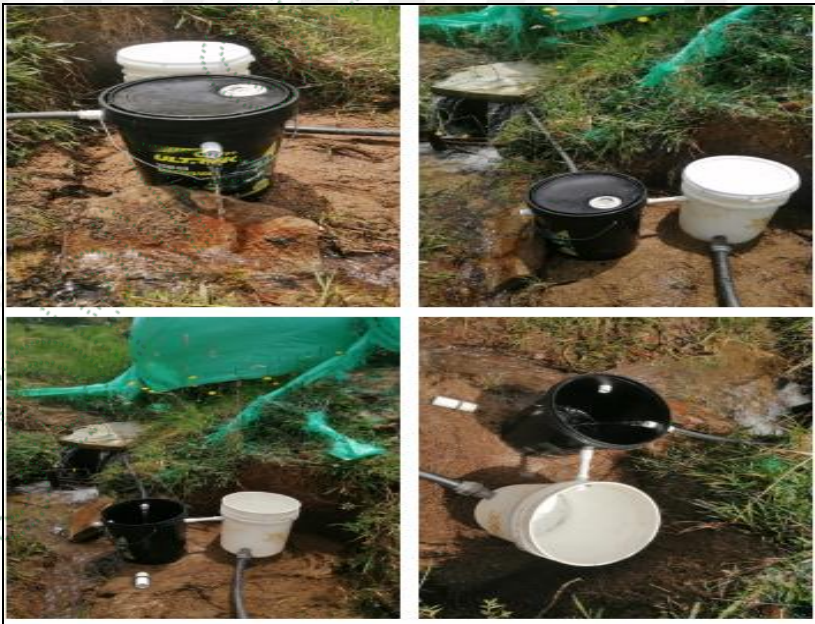
Ejemplo de obra control de caudal económica (diseño)