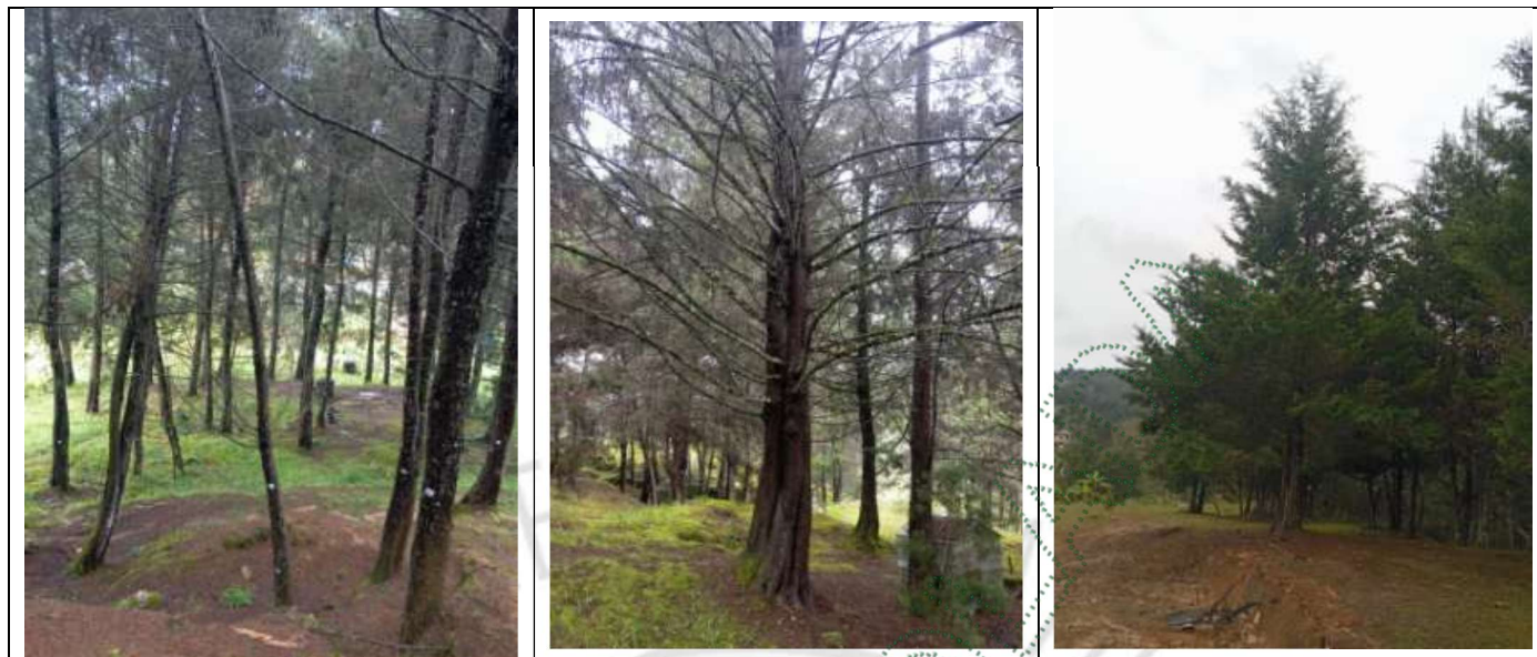
Imagen 3. Árboles objeto del aprovechamiento