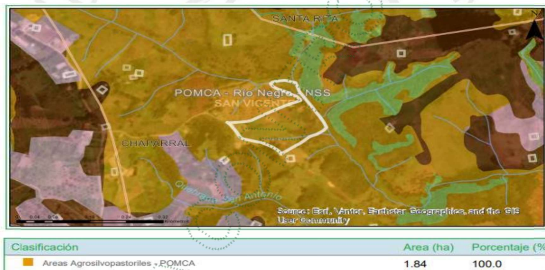
Imagen 2. Determinantes predio de interés

3.4 Localización de los árboles aislados a aprovechar con respecto a Acuerdos Corporativos y al Sistema de Información Ambiental Regional: De acuerdo con el Sistema de Información Geográfica de Cornare, el predio de interés se encuentra al interior de los límites del Plan de Ordenación y Manejo de la Cuenca Hidrográfica POMCA del Río Negro, aprobado en Cornare mediante la Resolución No. 112-7296 del 21 de diciembre de 2017 y mediante la Resolución No. 112-4795 del 8 de noviembre de 2018, estableció el régimen de usos, además, por medio de la resolución RE-04227-2022 del 1 de noviembre de 2022 se modifica el régimen de usos al interior. Obteniendo para la zona de interés: áreas agrosilvopastoriles.