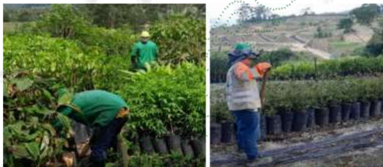
Registro fotográfico, fuente parte interesada

Por otra parte, los monitoreos y controles fitosanitarios en campo fueron realizados por personal técnico y se realizaron por zonas con el objetivo de cubrir toda el área y prevenir cualquier situación que pudiera poner en riesgo el desarrollo normal de árboles, arbustos y plantas herbáceas establecidas a partir de su ubicación y morfología.