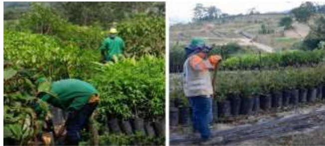
Registro fotográfico, fuente parte interesada: