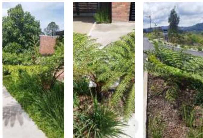
Individuos bajo categoría de veda sembrados

Cómo observación adicional, se informa que, en conjunto con la siembra, se realiza la reposición ambiental de los individuos autorizados en el expediente ambiental 056150623034. Para lo cual se realizará el informe correspondiente. Mediante el radicado evaluado se relaciona la compensación ambiental en aras de dar cumplimiento de las obligaciones establecidas en los actos administrativos (131-0064-2016 del 21 de enero del 2016, (APROVECHAMIENTO FORESTAL DE BOSQUE NATURAL UNICO, expediente 056150623034) y (131-1030-2020 del 14 de agosto del 2020, aprovechamiento forestal de árboles aislados por fuera obra privada 056150635867).