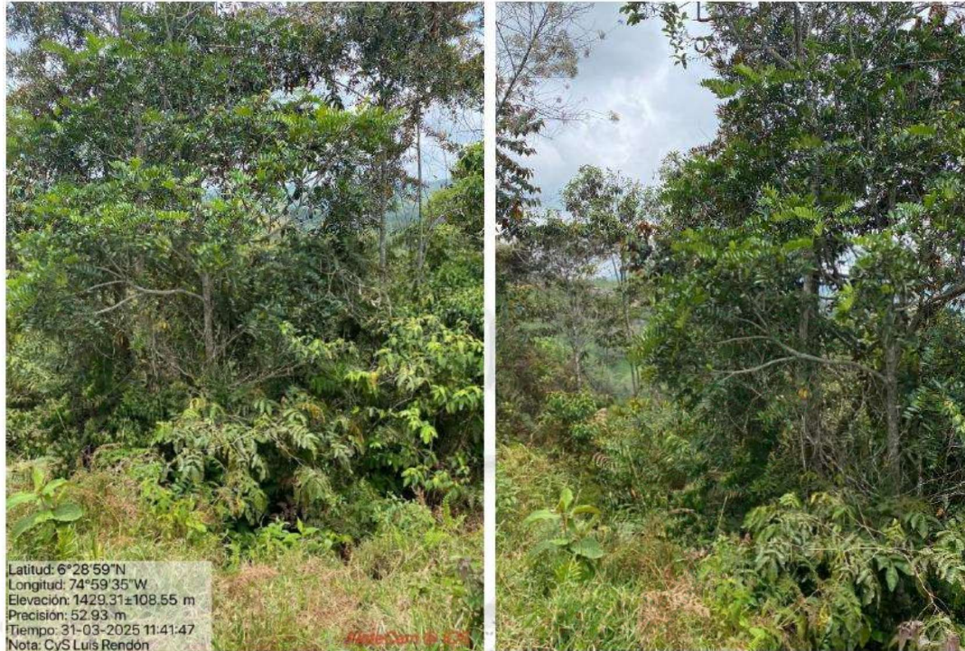
Imágenes 3 y 4. Estado actual de la ronda hídrica de la fuente Sin nombre.

En cuanto a la verificación de los requerimientos establecidos en la RE-02473-2023 del 20/06/2023 se tiene: