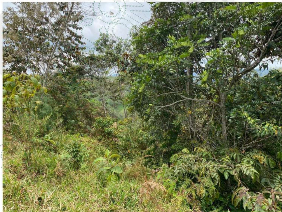
Imagen 2. Lugar donde se realizó la tala.

En el lugar donde se realizó la tala persiste un barbecho o rastrojo alto con presencia de árboles nativos, helechos y gramíneas, además, no se evidencian rastros de otros aprovechamientos ni se encuentra ganado bovino u otros animales. En el sitio se permitió la restauración pasiva y no se realizan usos agropecuarios del terreno.