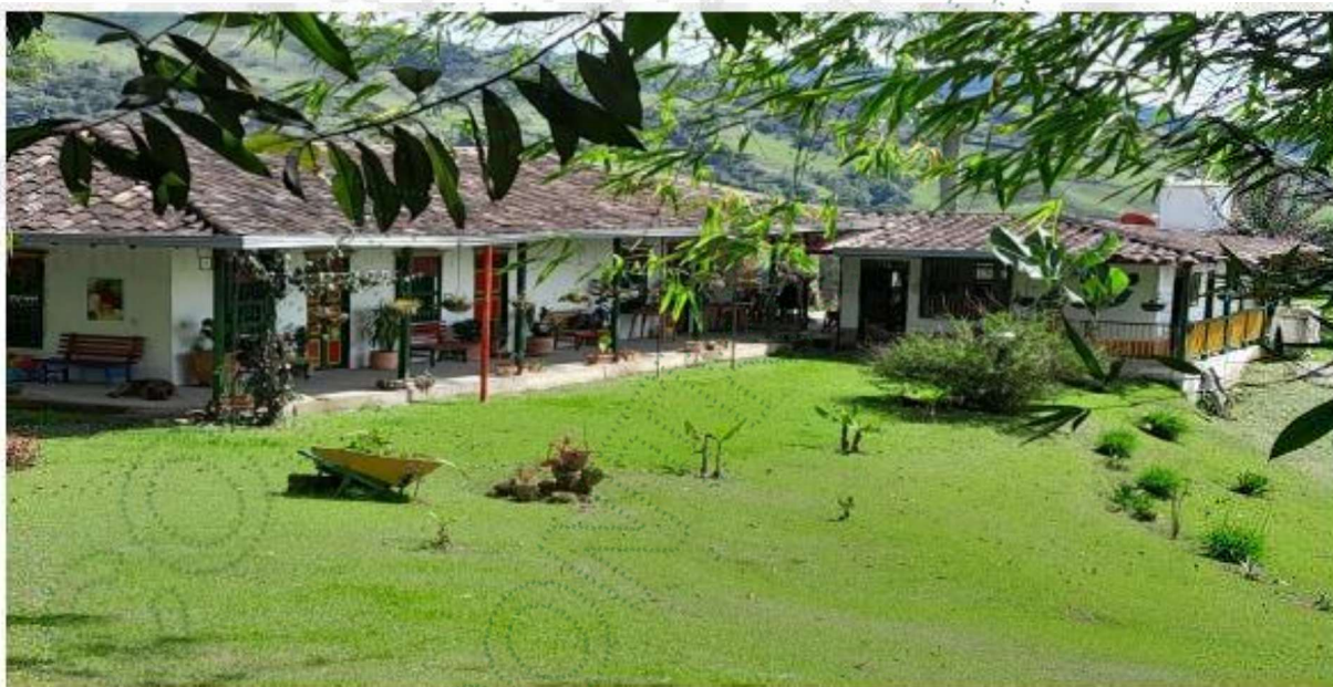
Imagen de la vivienda