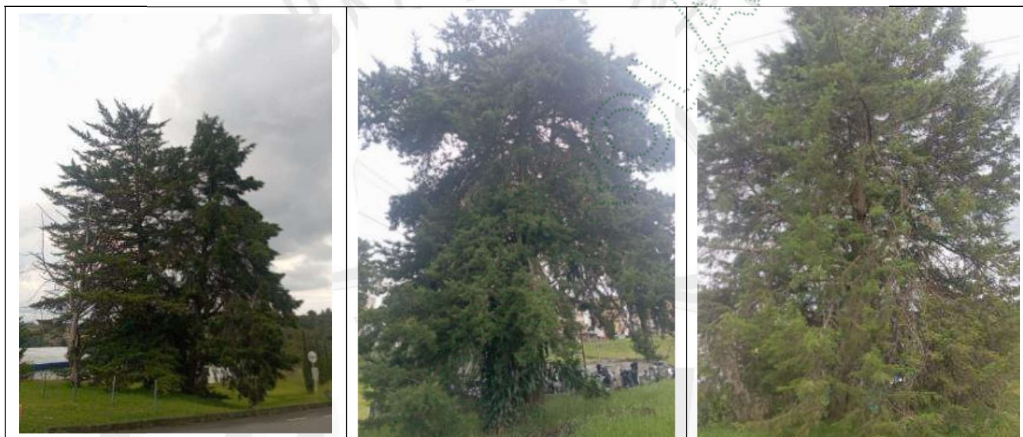
Imagen 3. Árboles a intervenir