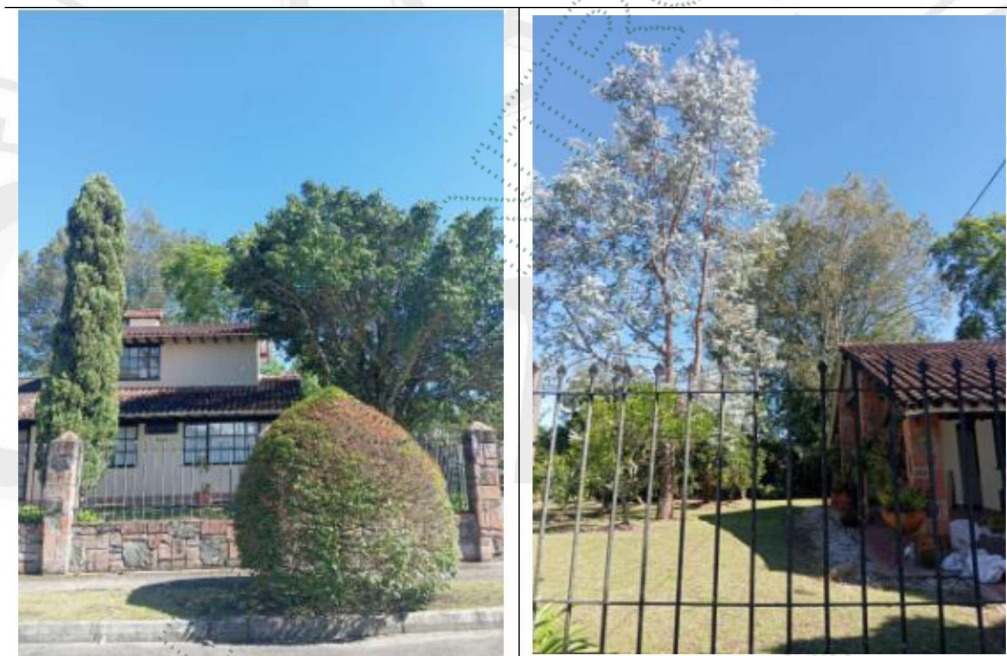
Imagen 3: árboles objeto de aprovechamiento