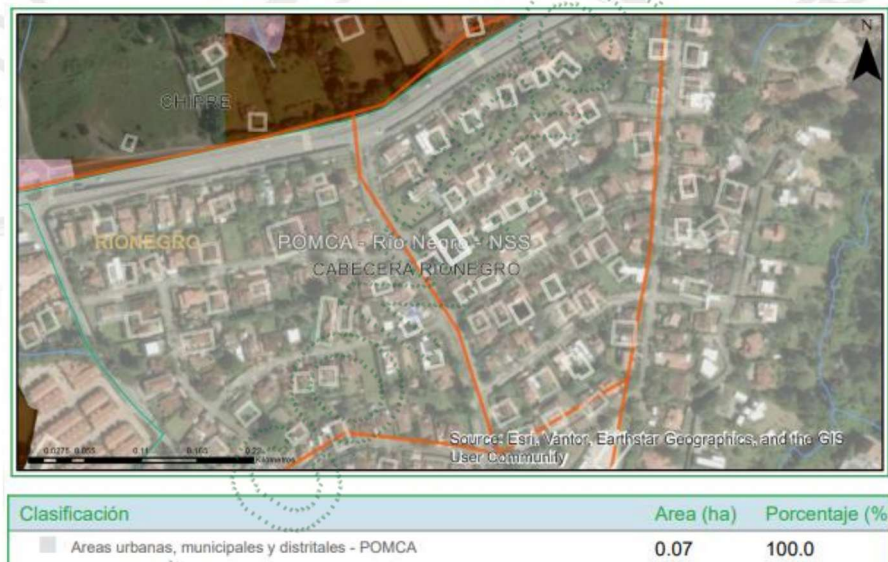
Imagen 2: Zonificación ambiental del predio