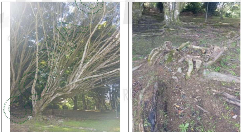
Imagen 3. Árboles objeto del aprovechamiento