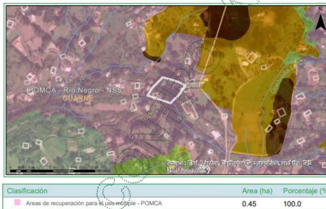
Imagen 2: Zonificación ambiental del predio

De acuerdo con el Sistema de Información Geográfica de CORNARE, los predios donde se ubica los árboles de interés hacen parte del Plan de Ordenación y Manejo de la Cuenca Hidrográfica POMCA del Río Negro, aprobado en CORNARE mediante la Resolución No 112-7296 del 21 de diciembre del 2017, De conformidad con la Resolución No. 112-4795 del 8 de noviembre del 2018 "Por medio de la cual se establece el régimen de usos al interior de la zonificación ambiental del Plan de ordenación y Manejo de la Cuenca Hidrográfica del Río Negro en la jurisdicción de CORNARE". Los arboles objeto de la solicitud se ubican en áreas: