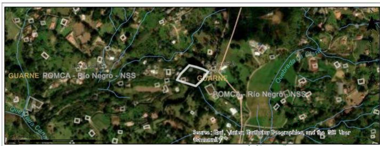
Imagen 1. Ubicación predio de interés