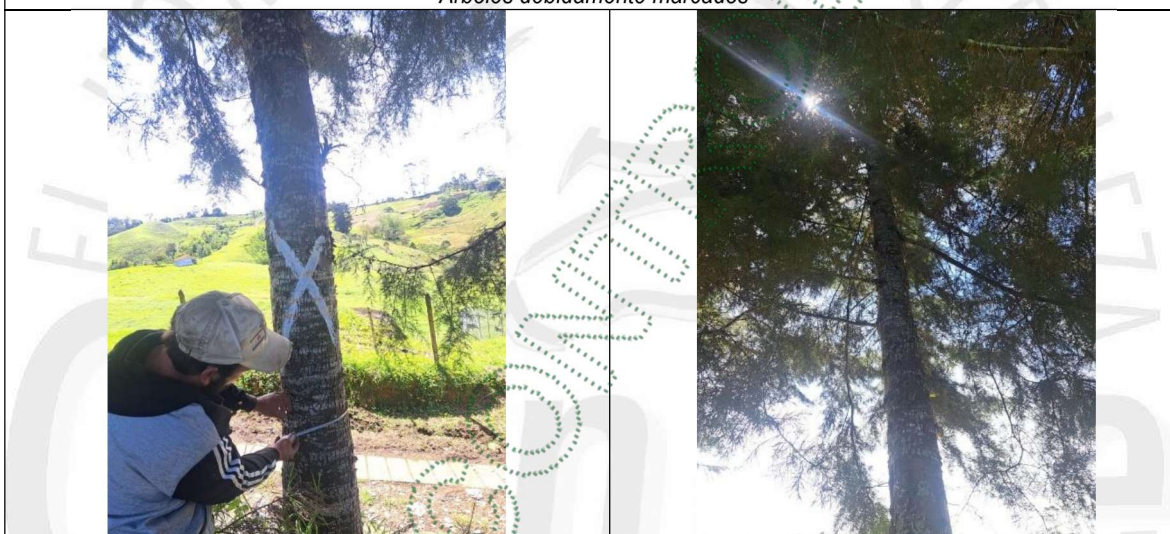
Arboles debidamente marcados