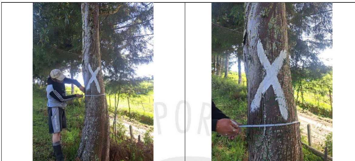
Arboles debidamente marcados