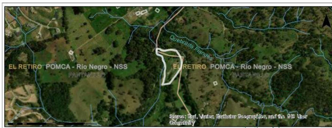
Imagen 1. Ubicación del predio de interés con FMI 017-22504.

De acuerdo con la información que reposa en la solicitud, los árboles objeto de aprovechamiento corresponden a: