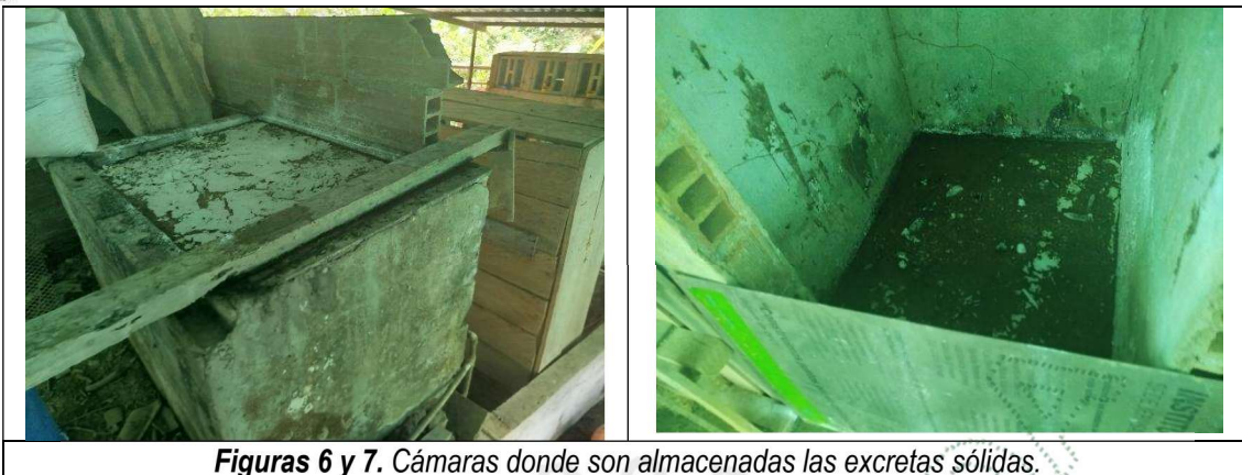
Figuras 6 y 7. Cámaras donde son almacenadas las excretas sólidas.