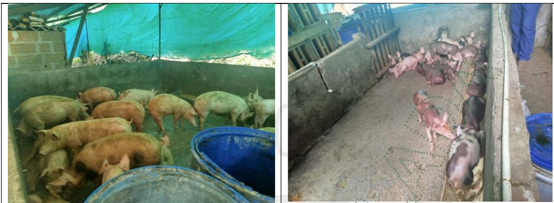
Figuras 2 y 3. Corrales para el desarrollo de la actividad porcícola