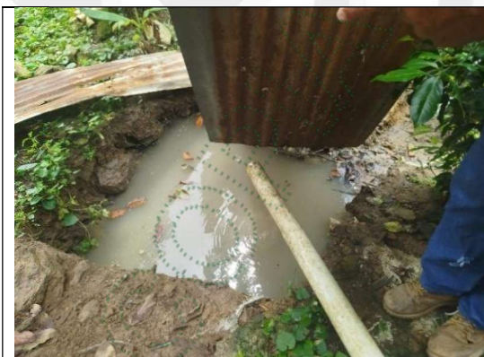
Figura 4. Hueco en el suelo desnudo para almacenar la porcina líquida.