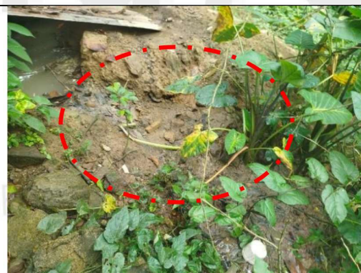
Figuras 5. Punto de escurrimiento a la quebrada contigua.