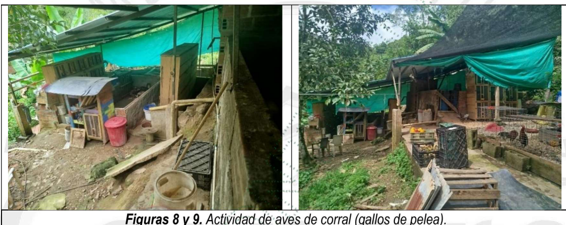
Figuras 8 y 9. Actividad de aves de corral (gallos de pelea).