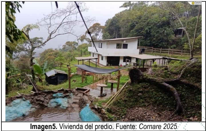
Imagen5. Vivienda del predio.