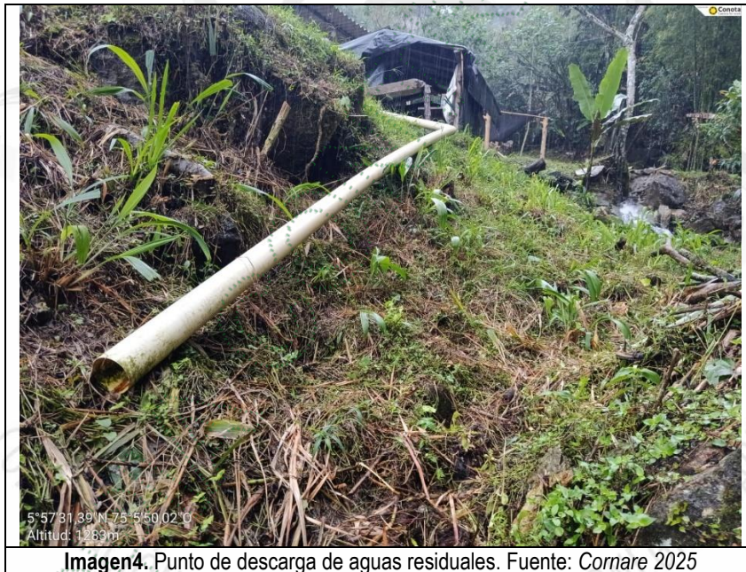
Imagen4. Punto de descarga de aguas residuales.