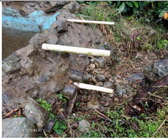
Imagen2. Tubería superior de rebose.