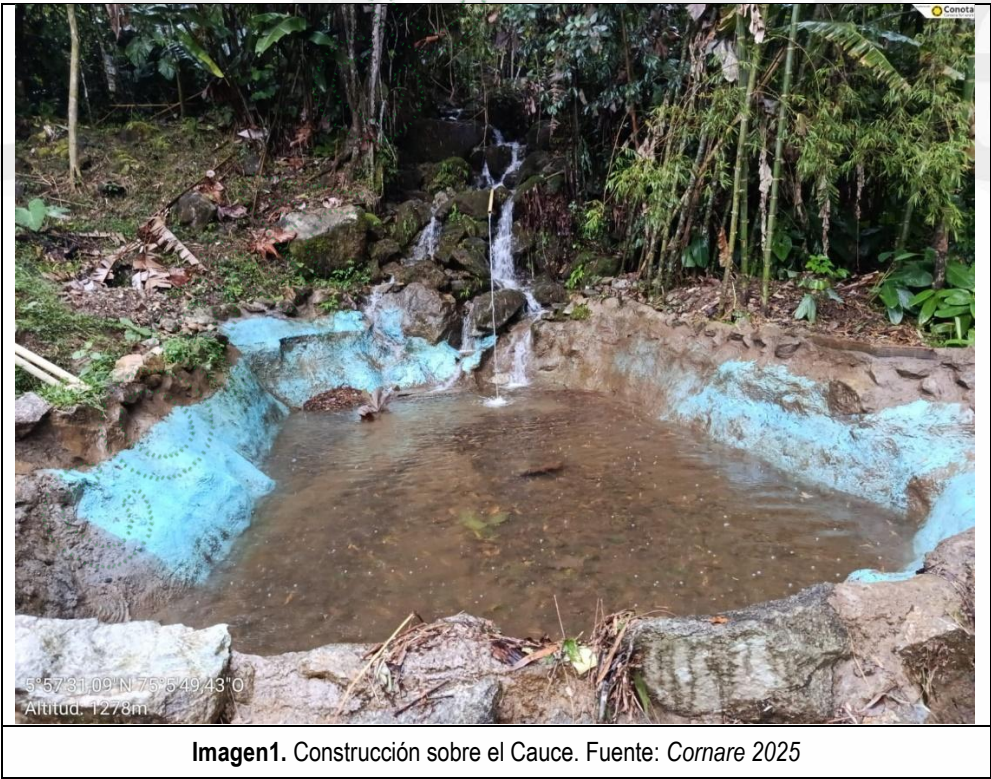
Imagen1. Construcción sobre el Cauce.