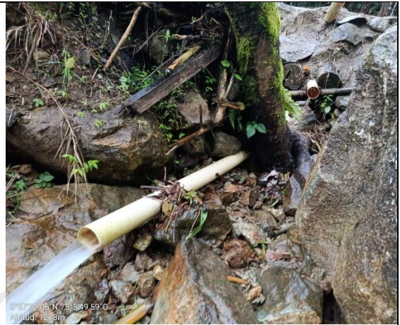
Imagen3. Tubería inferior.