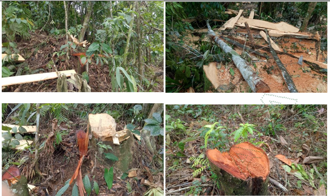
Imagen 2,3,4, 5. Registros de los tocones y puntos de apeo de los árboles.