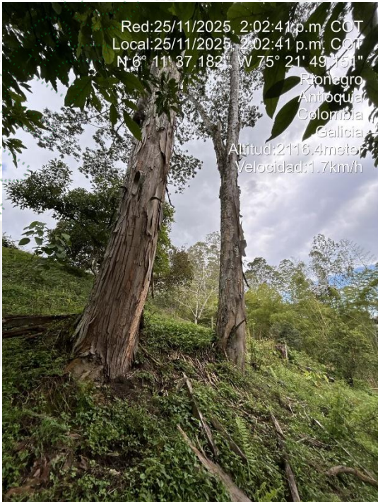
Imagen 3 y 4. Arboles a intervenir

4.1 Viabilidad: Técnicamente se considera VIABLE el APROVECHAMIENTO FORESTAL DE ÁRBOLES AISLADOS POR FUERA DE LA COBERTURA DE BOSQUE NATURAL , en el predio con FMI 020-83269, ubicado en la vereda Galicia del municipio de Rionegro, para la siguiente especie: