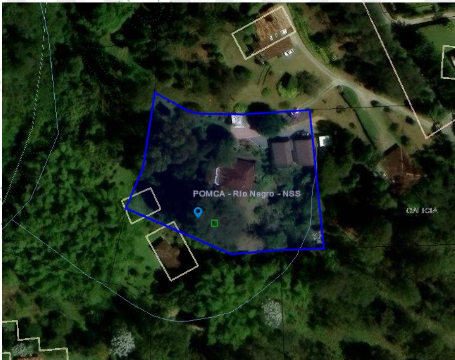
Imagen 1. Ubicación predio de interés

3.2 En cuanto al predio donde se ubican los árboles de interés: Se encuentra ubicado en la vereda Galicia del municipio de Rionegro, presenta un paisaje de altiplanicie con un relieve de lomas y colinas, además, hace parte de un centro poblado rural conforme el POT del municipio. El objetivo del aprovechamiento es prevenir accidentes por la altura de los árboles y su cercanía con vivienda vecina, ya que previamente se presentó un volcamiento de un árbol en la misma zona con las mismas condiciones.