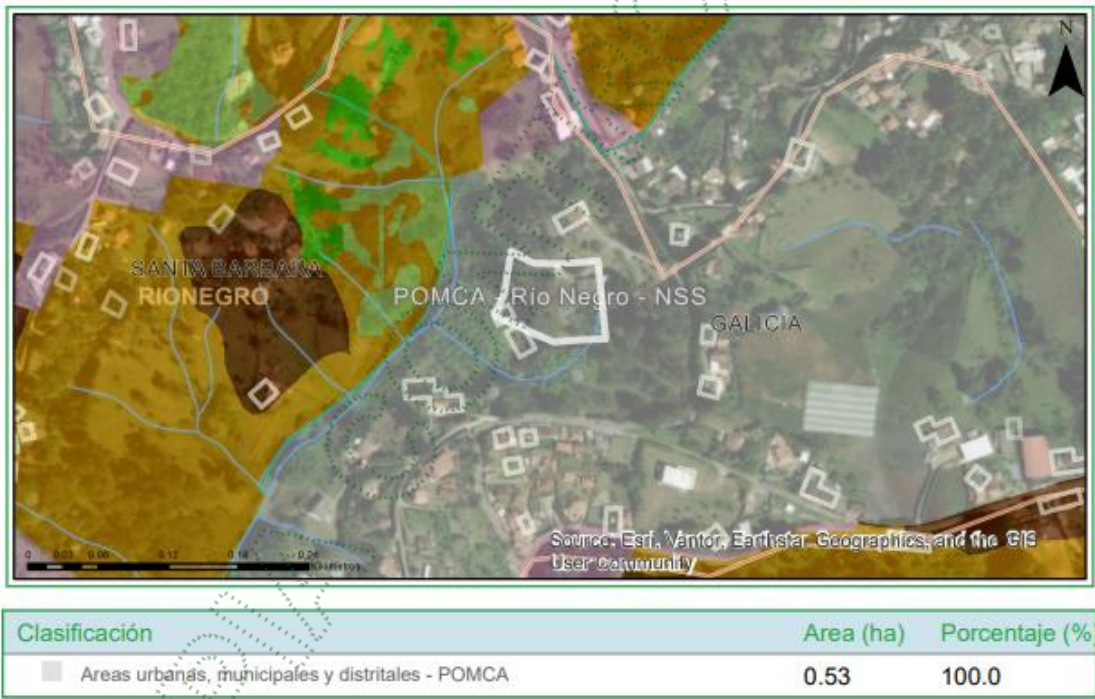
Imagen 2. Determinantes predio de interés

3.4 Localización de los árboles aislados a aprovechar con respecto a Acuerdos Corporativos y al Sistema de Información Ambiental Regional: De acuerdo con el Sistema de Información Geográfica de Cornare, el predio de interés se encuentra al interior de los límites del Plan de Ordenación y Manejo de la Cuenca Hidrográfica POMCA del Río Negro, aprobado en Cornare mediante la Resolución No. 112-7296 del 21 de diciembre de 2017 y mediante la Resolución No. 112-4795 del 8 de noviembre de 2018, estableció el régimen de usos, además, por medio de la resolución RE-04227-2022 del 1 de noviembre de 2022 se modifica el régimen de usos al interior. Obteniendo para la zona de interés: áreas urbanas.