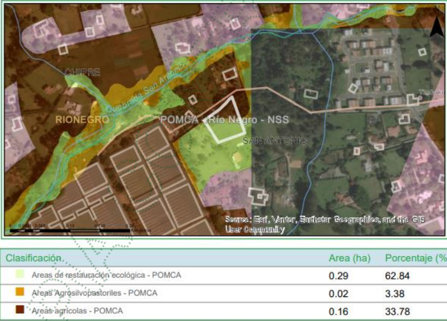
Imagen 2. Determinantes predio de interés

3.4 Localización de los árboles aislados a aprovechar con respecto a Acuerdos Corporativos y al Sistema de Información Ambiental Regional: De acuerdo con el Sistema de Información Geográfica de Cornare, el predio de interés se encuentra al interior de los límites del Plan de Ordenación y Manejo de la Cuenca Hidrográfica POMCA del Río Negro, aprobado en Cornare mediante la Resolución No. 112-7296 del 21 de diciembre de 2017 y mediante la Resolución No. 112-4795 del 8 de noviembre de 2018, estableció el régimen de usos, además, por medio de la resolución RE-04227-2022 del 1 de noviembre de 2022 se modifica el régimen de usos al interior. Obteniendo para la zona de interés: áreas de restauración ecológica, agrosilvopastoriles y agrícolas.