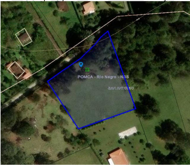
Imagen 1. Ubicación predio de interés

3.2 En cuanto al predio donde se ubican los árboles de interés: Se encuentra ubicado en la vereda San Antonio del municipio de Rionegro, presenta un paisaje de altiplanicie con un relieve de terrazas y abanicos, además, hace parte de la categoría de suburbano conforme el POT del municipio. El objetivo del aprovechamiento es adecuar el espacio para la construcción de vivienda y urbanismo al interior.