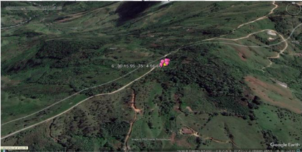
Figura 2. Visualización geográfica área de afectación, predio de interés, vereda el Brasil, municipio de Santo Domingo, Antioquia.