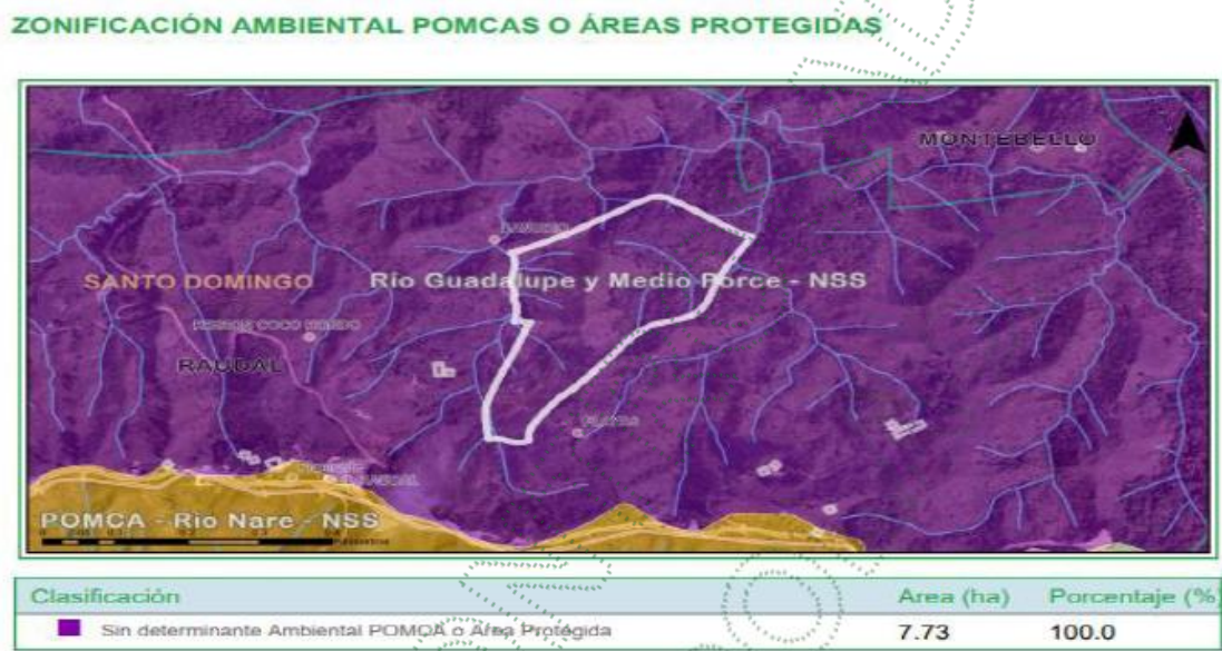
Figura 4. Información Zonificación Ambiental POMCA Río Nus y Áreas protegidas para el predio de interés, vereda el Brasil, municipio de Santo Domingo, Antioquia.

3.13. Por lo anterior, se menciona que, de acuerdo a las coordenadas tomadas en campo y traslapando la información POMCA, el predio no cuenta determinantes ambientales: