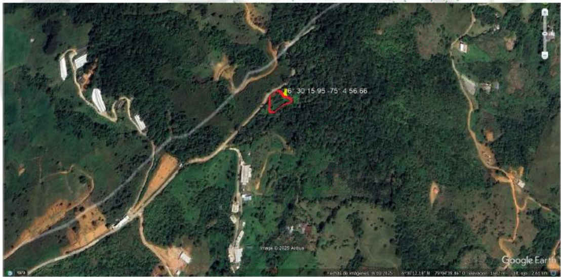
Figura 1. Visualización geográfica del predio de interés, vereda El Brasil, municipio de Santo Domingo, Antioquia.

3.3. A continuación, se observa un mapa descriptivo con la ubicación mencionada anteriormente; el mapa se realiza a partir del aplicativo Google Earth y de las coordenadas georreferenciadas en la visita técnica.