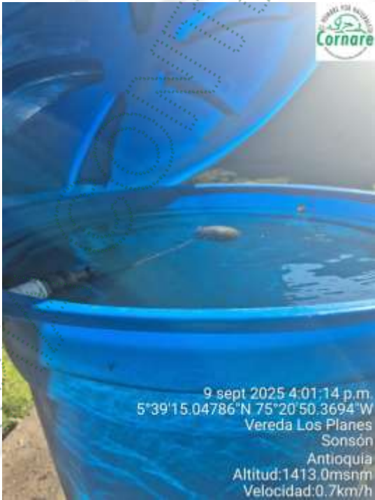
Imagen 4. Tanque de almacenamiento 3 con flotador y llaves para el control de flujo.