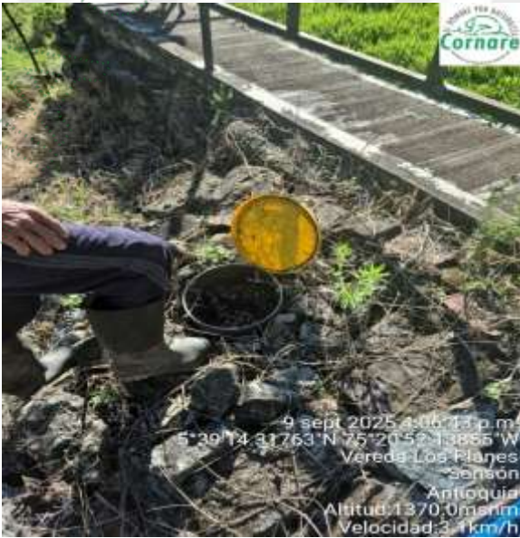
Imagen 6. Pozo de desactivación.

Ruta: www.cornare.gov.co/sqi /Apoyo/Gestión Jurídica/Anexos