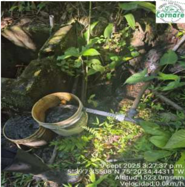
Imagen 1. Obra de captación implementada.

Se verificó el punto de captación ubicado en las coordenadas 5°39'7.35" N y 75°20'34.44" W, donde se identificaron dos fuentes denominadas “La Cancha 1” y “La Cancha 2”, las cuales confluyen en un cauce principal, en dicho cauce se observaron dos baldes que conducen el recurso hídrico hacia tres tanques de almacenamiento. La obra de captación implementada se realizó de forma conjunta para las dos fuentes, además, no cumple con los diseños establecidos en la concesión de aguas.