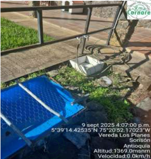
Imagen 5. Poceta y caneca para el lavado de equipos.

Se evidenció el lugar donde se lleva a cabo el lavado de los equipos de fumigación (poceta), el lavado de bombas (caneca azul) y el pozo de desactivación.