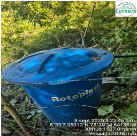
Imagen 2. Tanque de almacenamiento 1 sin flotador.