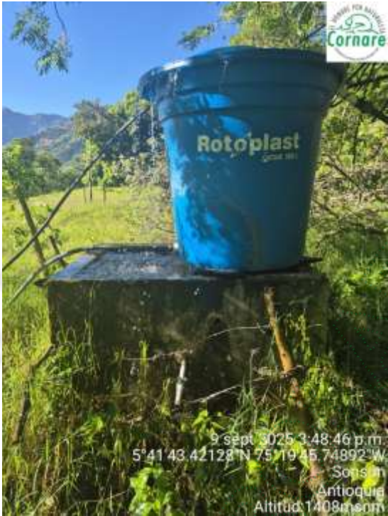
Imagen 3. Tanque de almacenamiento 2 con flotador

En el tanque de almacenamiento 2 se evidenció perdidas del recurso, el cual rebosaba del tanque