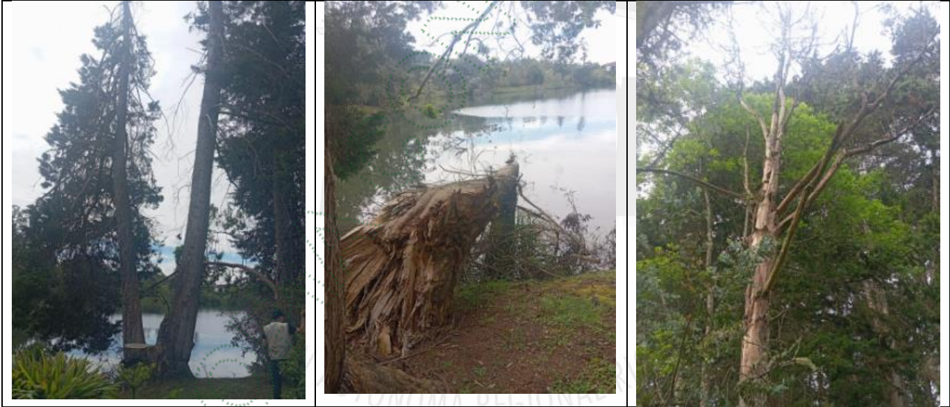
Imagen 3. Árboles objeto del aprovechamiento

4.1 Viabilidad: Técnicamente se considera VIABLE el APROVECHAMIENTO FORESTAL DE ÁRBOLES AISLADOS , en beneficio del predio identificado con Folio de Matrícula Inmobiliaria 017-18014, ubicados en la vereda Los Salados del municipio del El Retiro –Antioquia, para las siguientes especies: