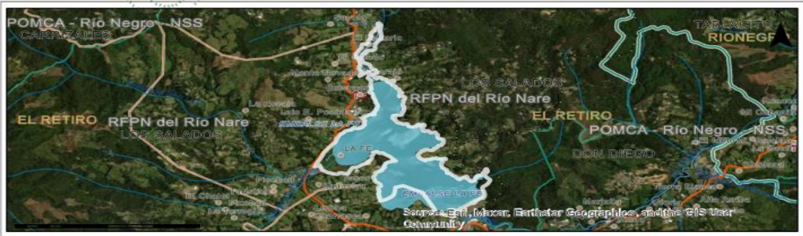
Imagen 1. Ubicación del predio de interés

En el predio se localiza el embalse de la Fe, cuerpo de agua, el objetivo del aprovechamiento es prevenir accidentes por las condiciones estructurales y fitosanitarias de los árboles y su crecimiento de copa.