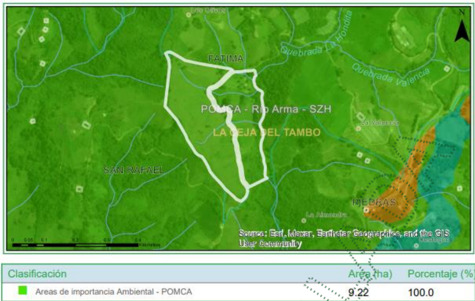
Imagen 2. Zonificación ambiental del predio según el POMCA del Río Arma.

Áreas de Importancia Ambiental - Otras subzonas de importancia ambiental - POMCA: Se deberá garantizar una cobertura boscosa de por lo menos el 70% en cada uno de los predios que la integran; en el otro 30% podrán desarrollarse las actividades permitidas en el respectivo Plan de Ordenamiento Territorial (POT) del municipio, así, como los lineamientos establecidos en los Acuerdo y Determinantes Ambientales de Cornare que apliquen. La densidad para vivienda campesina será la establecida en el POT y para la vivienda campestre será de tres (3) viviendas por hectárea.