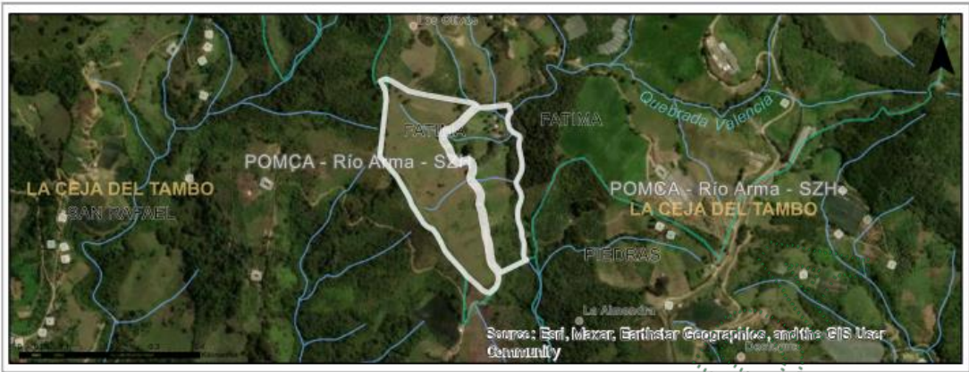
Imagen 1. Ubicación del predio de interés con FMI 017-5036.

De acuerdo con la información que reposa en la solicitud, los árboles objeto de aprovechamiento corresponden a: