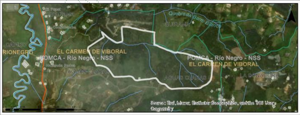
Imagen 1: Ubicación del predio de interés

En relación con los predios de interés: De acuerdo con el Sistema de Información Geográfica de Cornare, el predio de interés corresponde al predio identificado con Folio De Matrícula Inmobiliaria No. 020-171884 y PK 1482001000004700237 (Folio Matriz) con un área de 33,9 ha, donde se localiza la Parcelación “Verde Campiña) el predio de interés es el identificado con el FMI 020-248175 y corresponde al Lote 25 12, este se localiza en la vereda Aguas Claras, del municipio de El Carmen de Viboral. El Predio presenta coberturas en pastos arbolados, con un paisaje de altiplanicie y relieve en lomas y colinas (Imagen 1.)