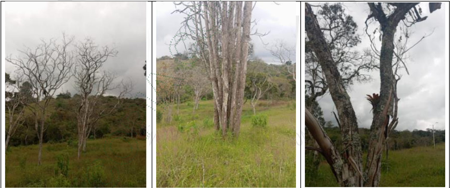
Imagen 3. Árboles objeto del aprovechamiento

4.1 Viabilidad: Técnicamente se considera VIABLE el APROVECHAMIENTO FORESTAL DE ÁRBOLES AISLADOS , en beneficio del predio identificado con el Folio de Matricula Inmobiliaria con FMI 020-248175 ubicado en la vereda Aguas Claras del Municipio de El Carmen de Viboral -Antioquia., para las siguientes especies: