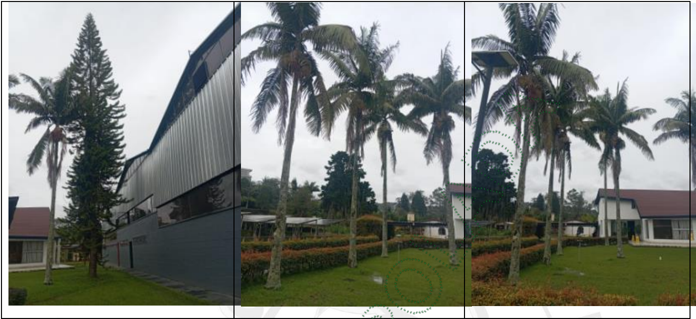
Imagen 4. Árboles objeto del aprovechamiento

4.1 Viabilidad: Técnicamente se considera VIABLE el APROVECHAMIENTO FORESTAL DE ÁRBOLES AISLADOS , en beneficio del predio identificado con el Folio de Matricula Inmobiliaria 020-78403, localizado en la vereda La Honda del municipio de Rionegro, para las siguientes especies: