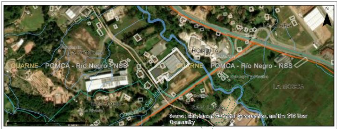
Imagen 1: Ubicación del predio de interés

El interesado presenta en la solicitud para ocho (8) individuos de la especie Palma Payanesea ( Archontophoenix Cunninghamiana ) y un individuo de la especie Araucaria ( Araucaria Heterophylla ) los cuales se ubican en zona verde en frente de construcción.