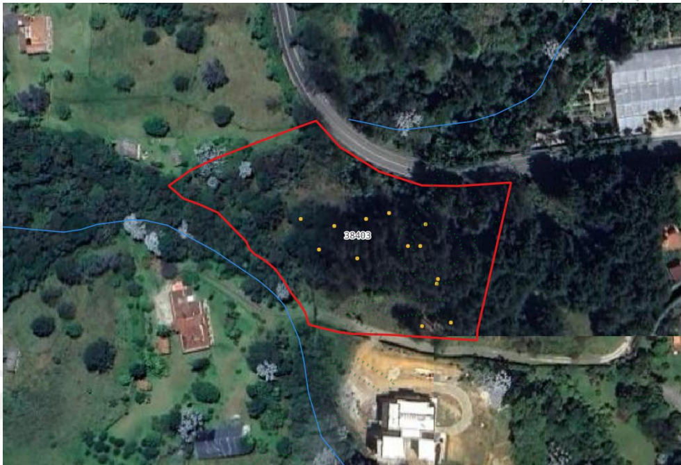
Localización de los árboles.

Los árboles se ubican de manera aislada en medio de coberturas en pastos limpios, corresponden a una regeneración natural de antiguos árboles que crecieron sin control ni actividades de mantenimiento silvicultural. El lote presenta una topografía ondulada que colinda con la Variante Palmas, y con la vía interna de la Parcelación El Chaquiro.