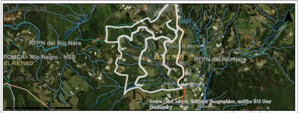
Imagen 1. Ubicación del predio de interés con FMI 017-7703.

De acuerdo con la información que reposa en la solicitud, los árboles objeto de aprovechamiento corresponden a: