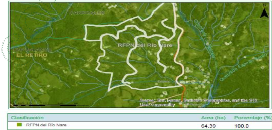
Imagen 2. Predio ubicado dentro de la RFRN Río Nare.

De acuerdo con el Sistema de Información Geográfica de Cornare, el predio de interés, se encuentra al interior de los límites del Plan de Ordenación y Manejo de la Cuenca Hidrográfica POMCA del Río Negro. El predio se encuentra en un 100% dentro de la Reserva Forestal Protectora Nacional Río Nare, aprobado por el Ministerio de Ambiente y Desarrollo Sostenible – MADS, declarado mediante el Acuerdo N° 31 de 2970 del 20 de noviembre de 1970 y redelimitado mediante la Resolución No. 1510 de 2010 del 5 de agosto de 2010 (Ver imagen 2). Según la zonificación para el predio con FMI 017-7703 con 64.38 hectáreas, se tiene que para la parcela donde reposa el presente trámite se encuentra en zona de Uso Sostenible (Ver imagen 3).