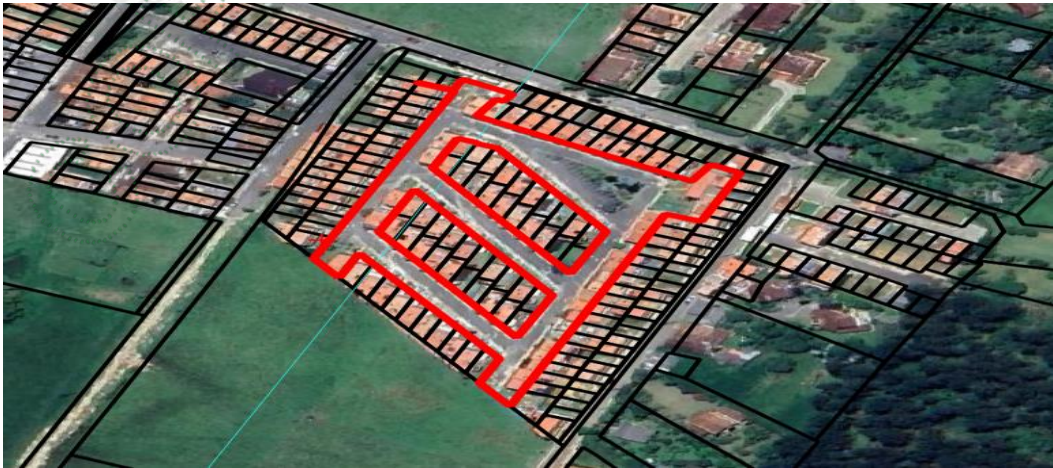
Imagen 1. Ubicación zonas comunes

3.2 En cuanto al predio donde se ubican los árboles de interés: Corresponde a zonas comunes al interior de la propiedad horizontal, ubicada en la zona urbana del municipio de La Ceja, presenta un paisaje de altiplanicie con un relieve de terrazas y abanicos. El objetivo del aprovechamiento es mitigar las afectaciones generadas en la infraestructura de las viviendas alrededor de los arboles por el crecimiento de las raíces y condiciones estructurales deficientes.