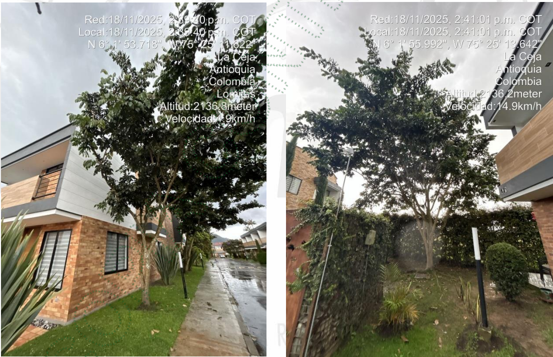
Imagen 3 y 4. Arboles a intervenir

4.1 Viabilidad: Técnicamente se considera VIABLE el APROVECHAMIENTO FORESTAL DE ÁRBOLES AISLADOS POR FUERA DE LA COBERTURA DE BOSQUE NATURAL , en zonas comunes de la propiedad horizontal, ubicada en zona urbana del municipio de La Ceja, para la siguiente especie: