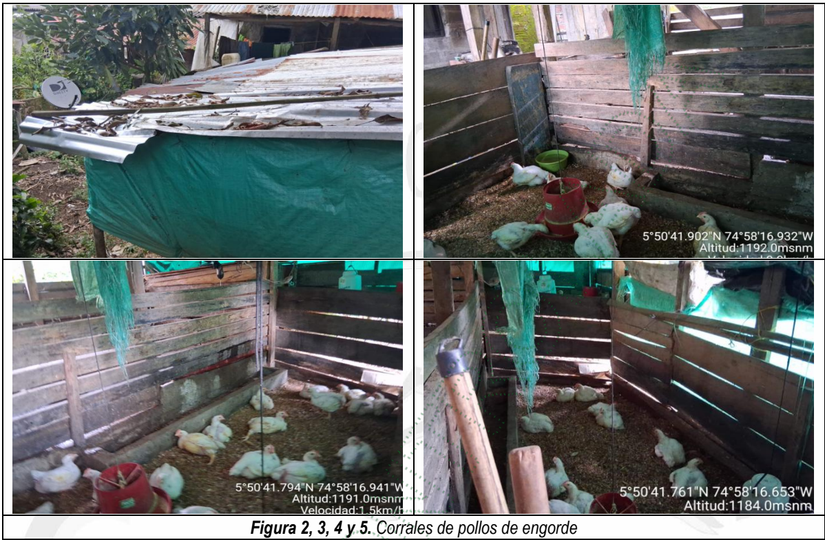
Figura 2, 3, 4 y 5. Corrales de pollos de engorde

25.3 Se permitió el ingreso del personal al predio, donde se evidenciaron corrales destinados al levante de pollos de engorde, actividad que — según indicó el señor Jairo— se realiza a pequeña escala y con fines de subsistencia. No se observaron cocheras para la cría de cerdos; por lo anterior, no se genera vertimiento alguno hacia la fuente hídrica. (ver figura 2, 3, 4 y 5).