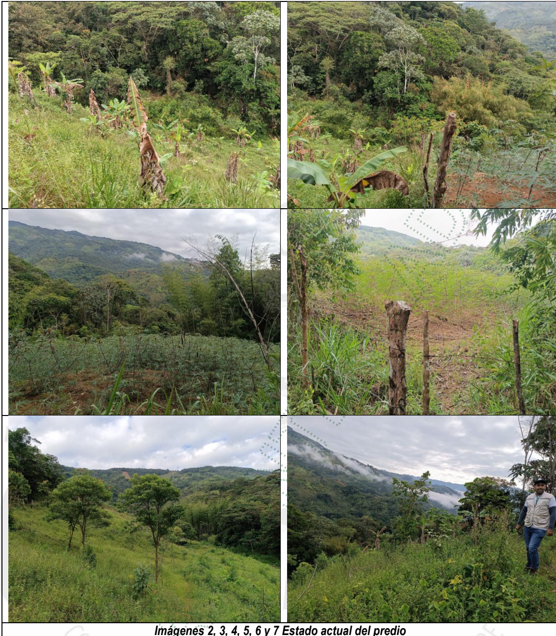
Imágenes 2, 3, 4, 5, 6 y 7 Estado actual del predio

25.4 De igual manera, se constató que algunos sectores del predio han sido convertidos en áreas de potrero, tal como lo mencionaron los implicados durante la última visita técnica. Esta transformación del uso del suelo sugiere una adecuación previa del terreno para actividades ganaderas o agropecuarias complementarias, lo que explica la apariencia más abierta en ciertas zonas. Lo cual indica que la intervención existente se mantiene estable y no presenta crecimiento progresivo hacia áreas boscosas o de especial importancia ambiental.