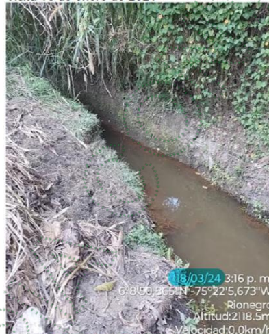
Ilustración 3 Registro de campo.