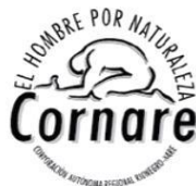
Visita 18 de enero de 2024