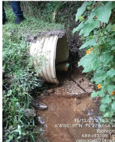
Ilustración 4 Registro de campo.

De acuerdo a lo anterior, el recurrente dice que la autoridad ambiental resolvió dar por cumplido el requerimiento efectuado a la sociedad INVERSIONES AURAGAN S.A.S. mediante el artículo 3 de la Resolución RE-00203 del 22 de enero de 2024, tal y como lo muestra en la siguiente imagen: