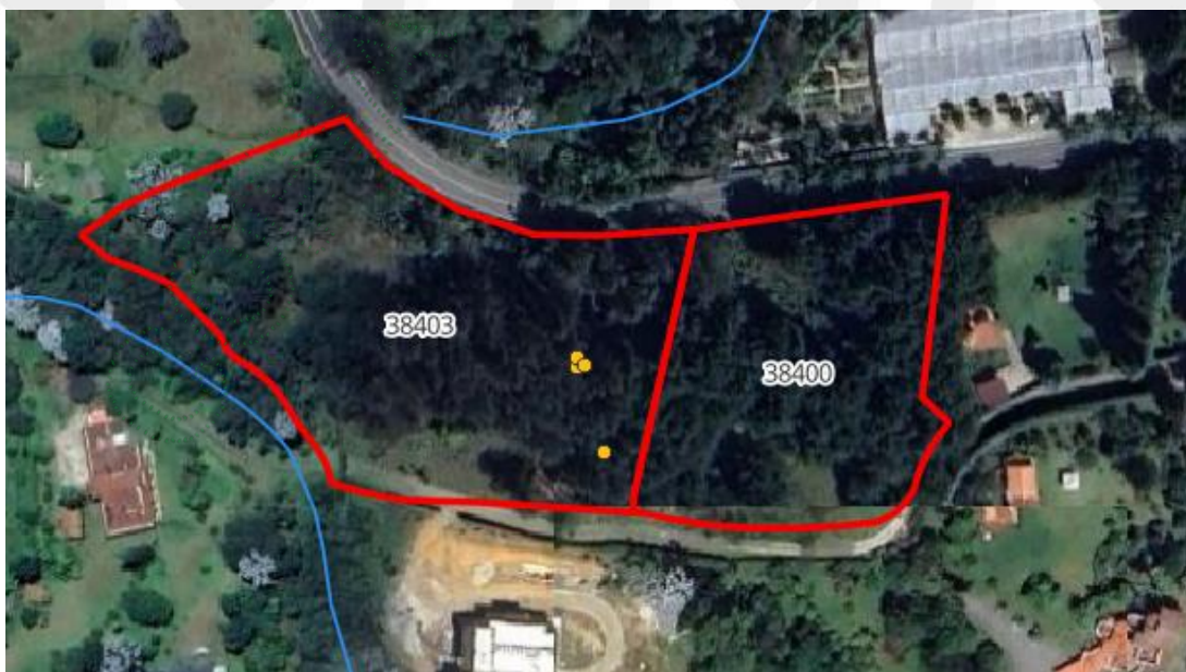
Imagen 5: Localización coordenadas del recorrido.

Las coordenadas obtenidas durante el recorrido del 10 de noviembre (relacionadas en las fotografías del informe), se localizan como se presenta en la imagen 5, verificando que fueron talados todos los árboles de la zona del lindero entre los predios y del área que presenta inconsistencias en la delimitación.