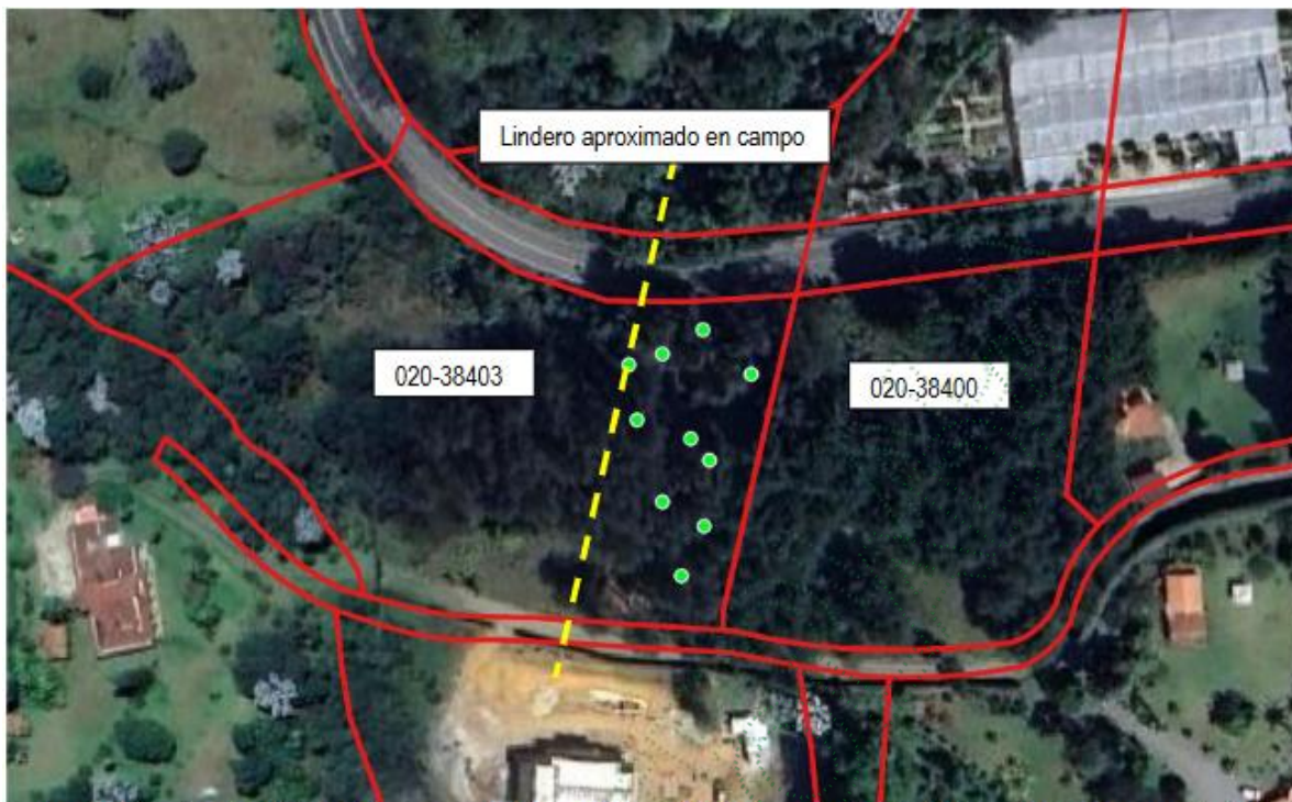
Imagen 1: localización de los árboles respecto a los predios, y delimitación aproximada del lindero físico (cerco en alambre).

Imagen 4: