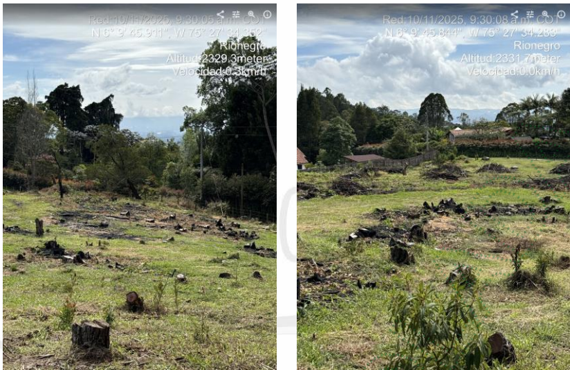
Imágenes 6 y 7: Quemas y manejo de residuos.

En cuanto al manejo de los residuos, se pudo observar que se realizaron algunas quemas de parte del material vegetal, y algunos residuos se encontraban dispuestos en pilas para su descomposición.