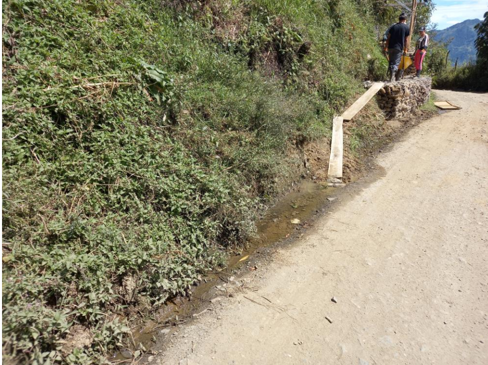
Imagen # 2 área de descarga aguas residuales domésticas.

De acuerdo al sistema de información geográfico de Cornare la totalidad del predio se ubica en el POMCA del Río Arma Resolución 112-0397 del 13 de febrero de 2019 con la siguiente zonificación ambiental: