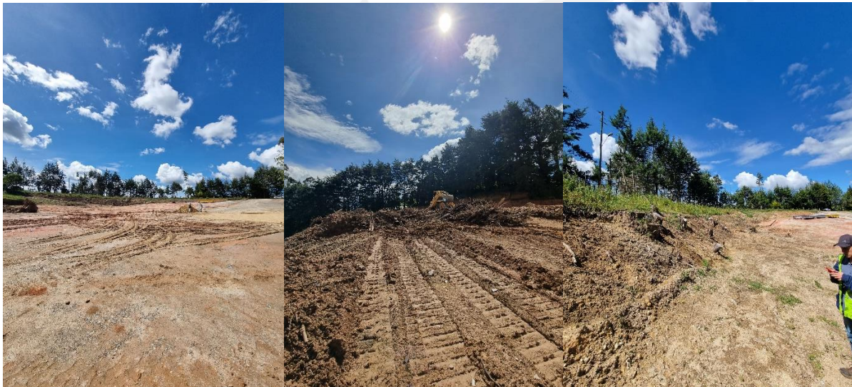
Zona de intervención